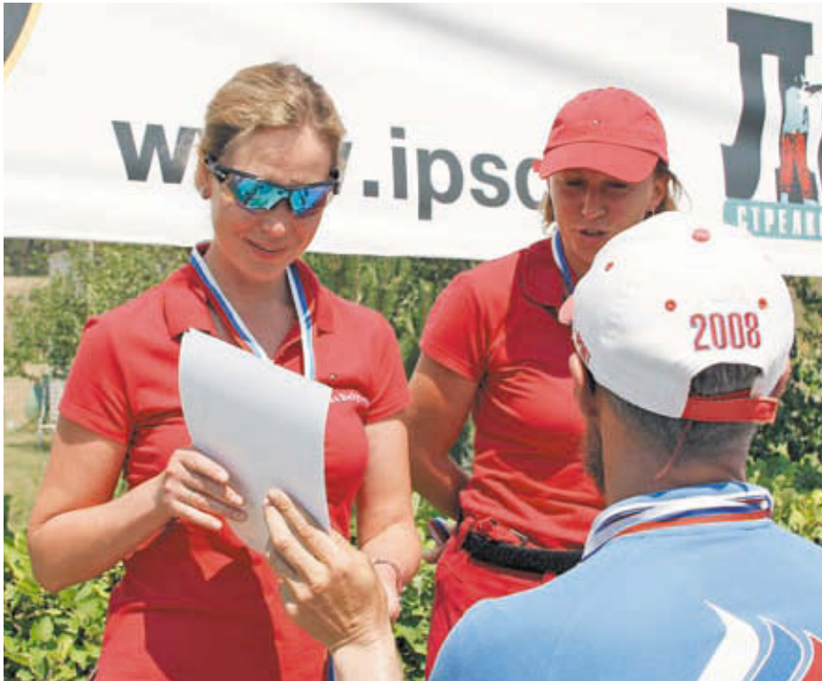
Награждаются стрелки команды «Л-клуб» за второе место в категории «Леди»

Очень порадовало количество и качество декораций на упражнениях. Были и «лошади», и туннели «Купера», и столы с наручниками, открывающиеся двери, окна, порты, факсы, кактусы, ёлки, грибы, чучела животных, плаха с топором и даже унитаз. Устроители постарались и получилось интересно. Упражнения на чемпионате были не очень трудными, это заметили многие, но этим организаторы дали возможность каждому проявить свои скоростные качества. Этим и воспользовались победители, хотя не обошлось и без сенсаций.