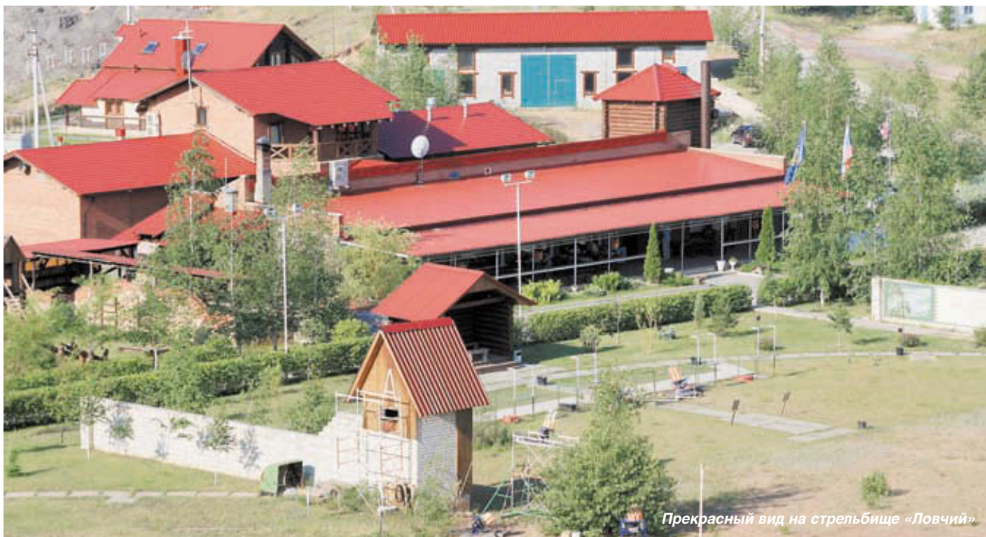
Прекрасный вид на стрельбище «Ловчий»

Стрельбище по-настоящему европейского уровня и размаха. Самое главное – это зона для практической стрельбы с обваловками на 14 упражнений, с возможностью проводить соревнования по практической стрельбе как из пистолета, так и из гладкоствольного ружья. А для удобства стрелков и гостей соревнований имеется приличная гостиница, большая парковка, ресторан, магазин, оружейная мастерская, хранилище оружия и патронов, баня, детская площадка, на каждом упражнении навесы