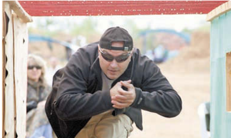
Передвижение по тоннелю Купера требует от стрелка внимания и разминки перед упражнением

Во всём мире (и мы не исключение) гражданские стреляют лучше, чем военные. Но американцам, например, проще, они дети второй поправки к Конституции США, разрешающей приобретение и ношение оружия. У нас всё развивалось «немного не так» и, поначалу, военные были лидерами, но недолго. Казалось бы, у военных и возможности тренироваться больше, и с оружием они постоянно, и на практике (то есть на войне) они его применяют, а боевые действия – это не соревнования, волнение там не сравнить с командой «Внимание!» и сигналом таймера. Но во всех классах оружия гражданские пока