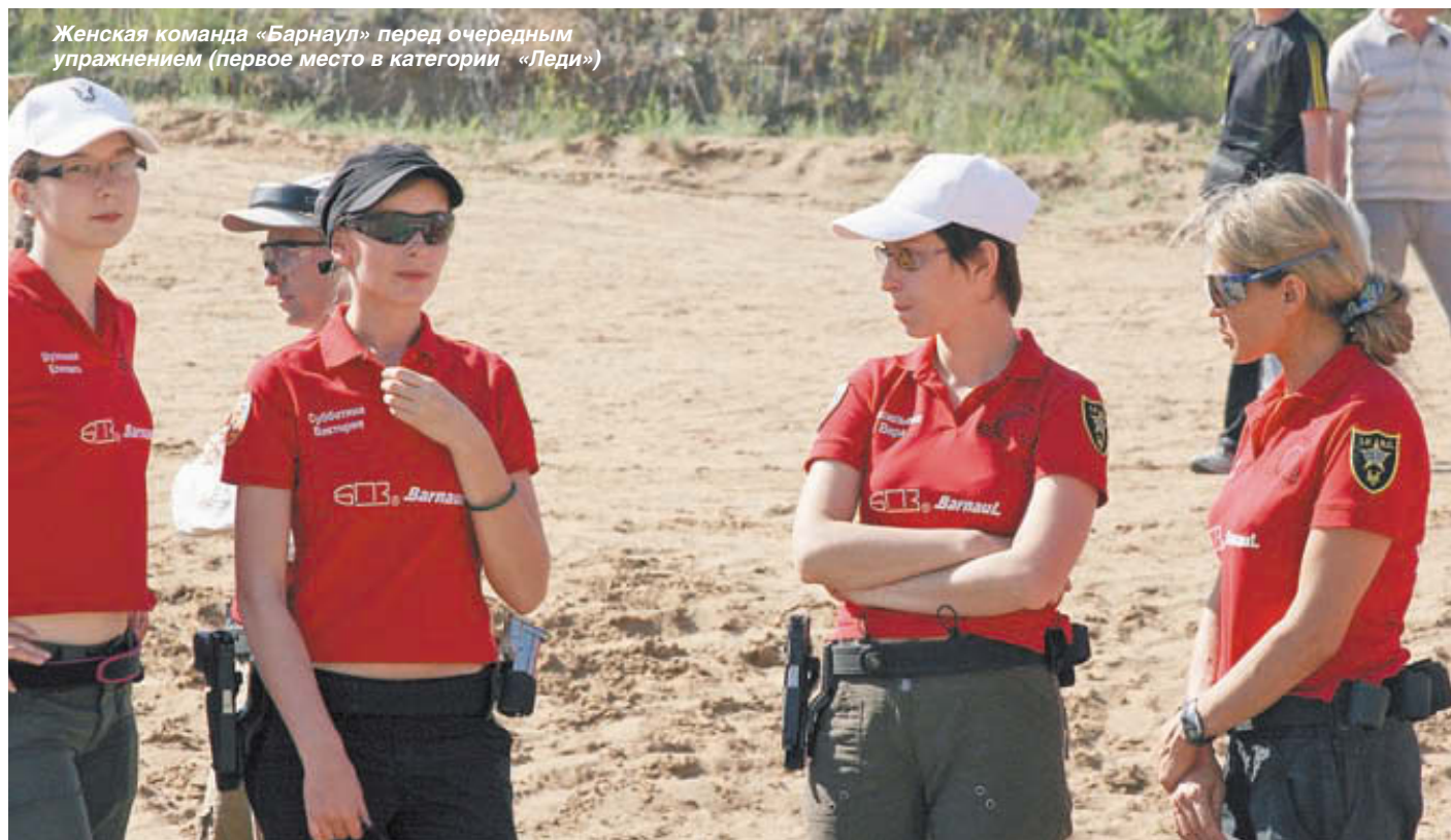
Женская команда «Барнаул» перед очередным упражнением (первое место в категории «Леди»)