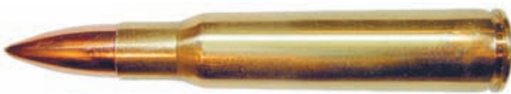
Внешний вид патрона 30-06 FMJ Springfield производства ЗАО «НПЗ»