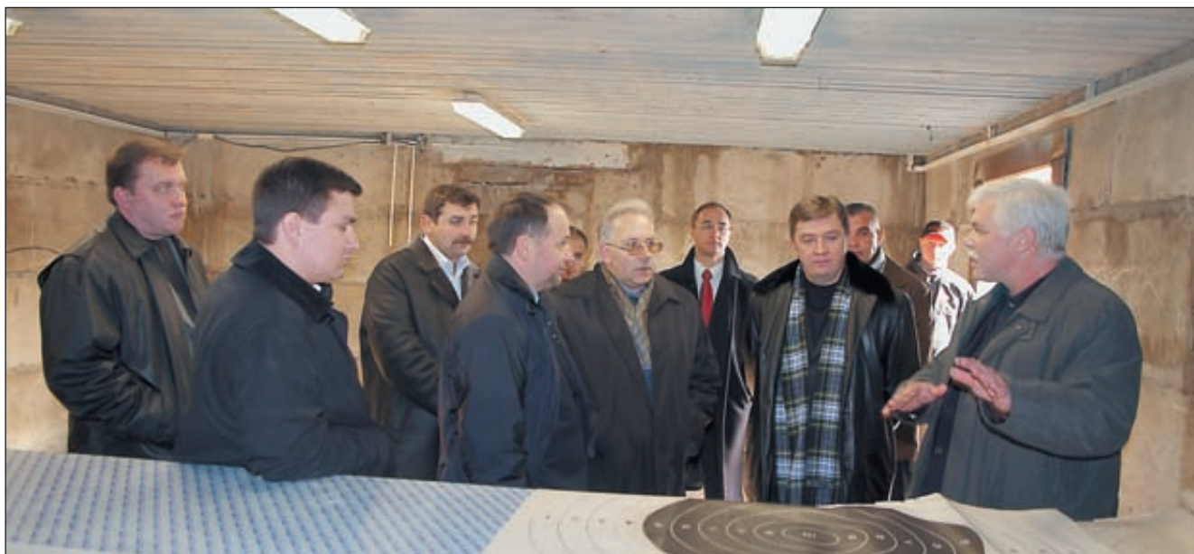
Участники конференции знакомятся с 300-метровым тиром

спорту для средних и высших физкультурных учреждений.