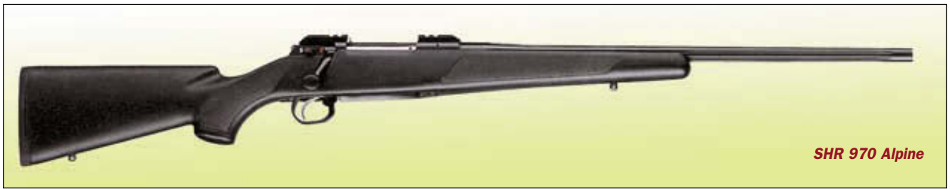
SHR 970 Alpine

вировкой. Если вы не относитесь к таким ценителям, а те охоты, в которых вы обычно участвуете, связаны с длительными пешими переходами, задумайтесь: есть ли смысл взваливать на спину лишние полкило, без которых вполне можно обой-