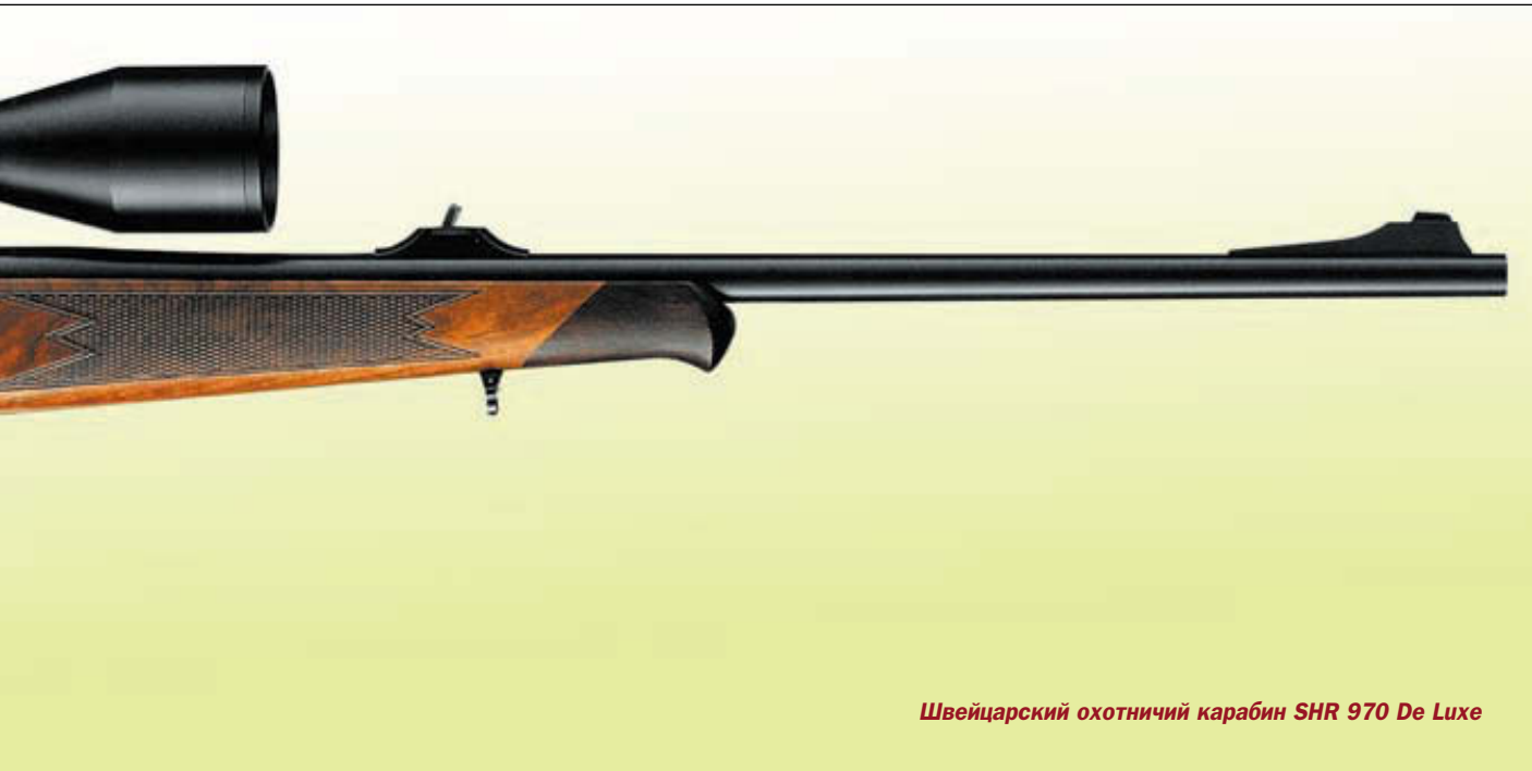
Швейцарский охотничий карабин SHR 970 De Luxe

Некоторые стрелки предпочитают сталь лёгкому сплаву из-за тяги к традиционализму, особенно если речь идёт об элитных образцах оружия, украшенных изысканной гра-