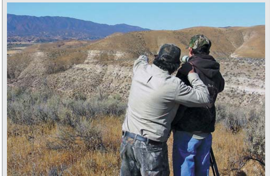
Разведка перед охотой особенно эффективна в случае с оленями Туле, которые не мигрируют. Здесь находятся 22 оленя на равнине слева от охотников, на расстоянии около 1200 ярдов от них.