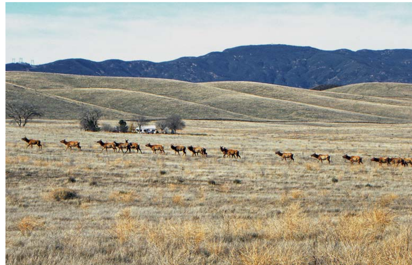
Оленям Туле по нраву сухой жаркий климат открытых пространств ранчо в центральной Калифорнии. А вот для охотников на них серьёзной проблемой может оказаться обезвоживание и тепловой удар