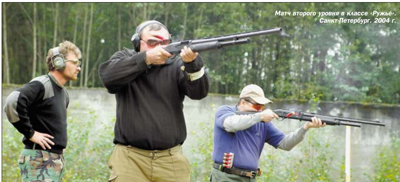
Матч второго уровня в классе «Ружьё». Санкт-Петербург. 2004 г.