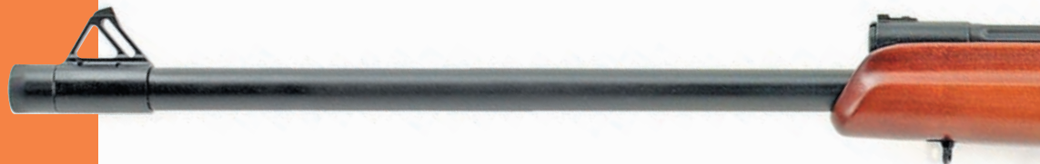
Самозарядный гладкоствольный охотничий карабин «Сайга-12» исп. «085»

На охоте же ограниченно использовались длинноствольные версии этой модели, причём с некоторыми типами пуль они показывали выдающуюся кучность – менее 15 см (поперечник) на 100 метров. На том этапе, наверное, даже конструкторы «Ижмаша» не могли предположить широту модернизационного потенциала системы Калашникова и если к появлению гладкоствольной «Сайги» 20-го калибра все отнеслись как должному развитию событий, то «Сайга-12» по-настоящему удивила сначала российский, а потом и международный оружейный рынок. С конца 90-х годов «Сайга» именно