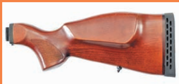
Конструкция «Сайги-12» исп. «085» позволяет отделить приклад что очень удобно при транспортировке и хранении оружия