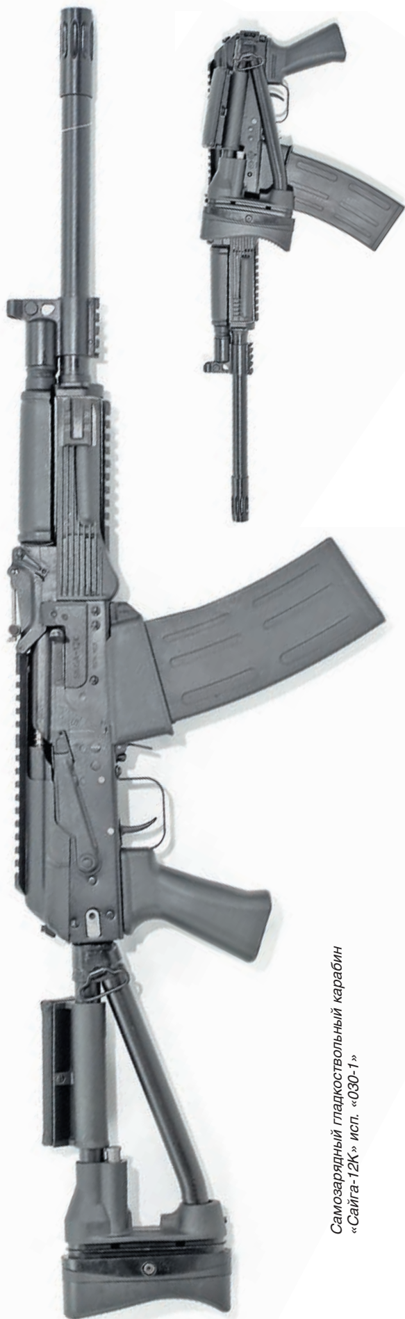
Самозарядный гладкоствольный карабин «Сайга-12К» исп. «030-1»

прикладами, такая система при транспортировке не требует специальных чехлов и может быть уложена более удобно. Кроме того, вместо приклада к ствольной коробке можно присоединить пистолетную рукоятку, превратив охотничье ружьё в маневренный полуавтомат для самообороны в ограниченном пространстве. На дульной части ствола «Сайги-12» в исполнении «085» имеется посадочное место для установки сменных дульных насадков, а на левой стороне ствольной коробки имеется планка для присоединения любых прицельных приспособлений.