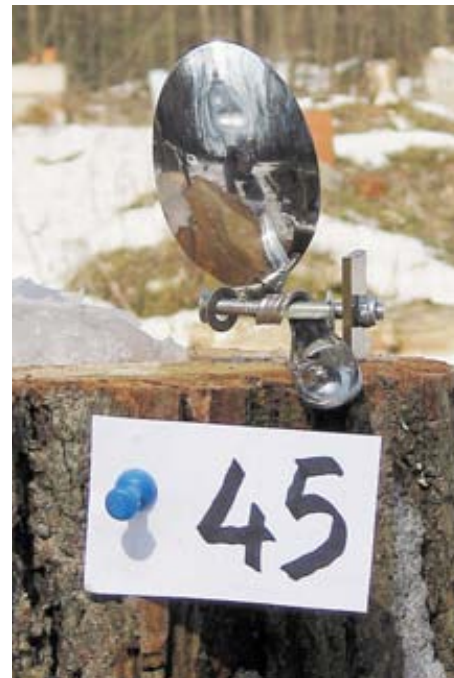
Мишень для варминта

В первый день разыгрывалось три комплекта наград. Результаты соревнования приведены в таблицах.