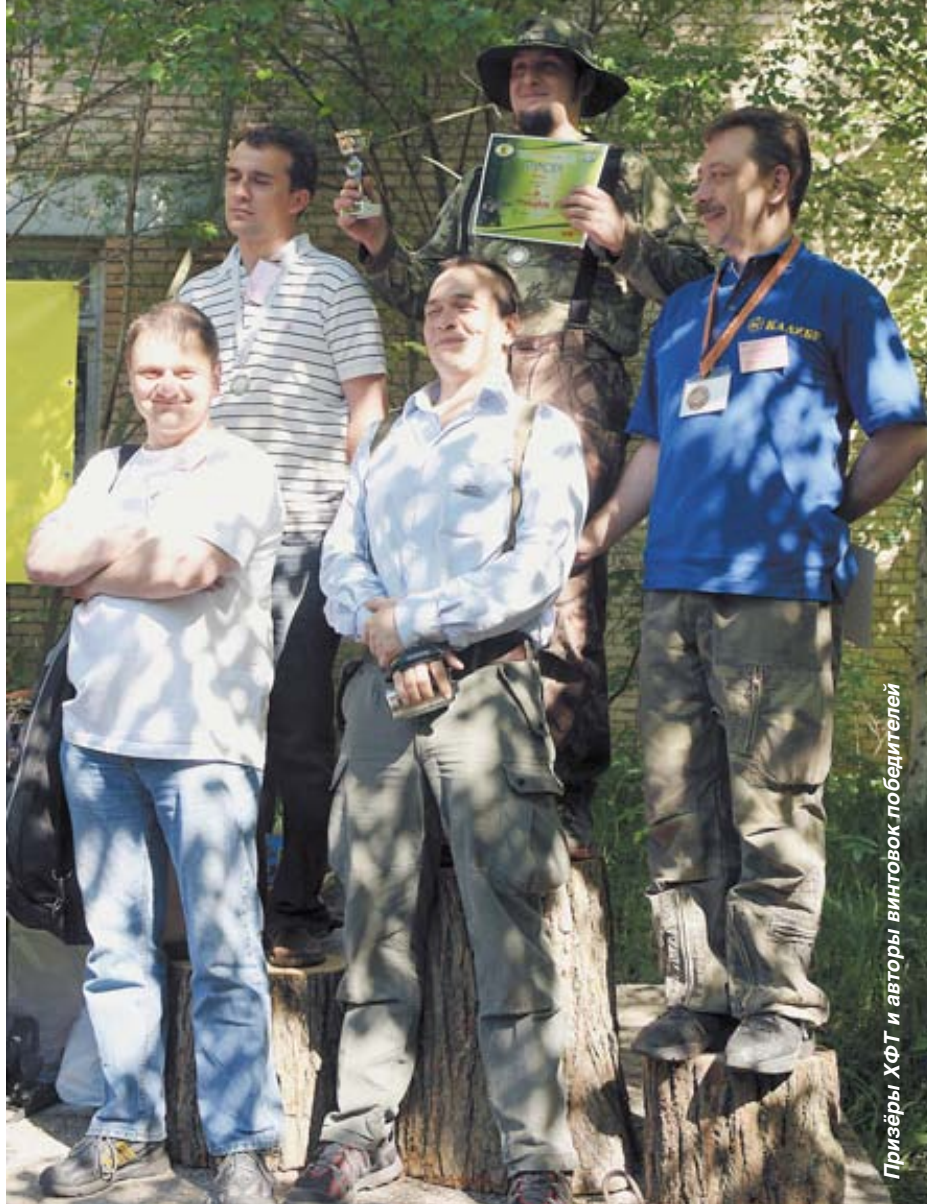
Призёры ХФТ и авторы винтовок победителей

Весенний Турнир НАФТ проводился всего второй раз, но по его итогам уже можно сказать, что любительский стрелковый спорт в нашей стране выходит на качественно новый уровень. Нынешние соревнования не только собрали рекордное количество участников, но и стали выставочной площадкой, на которой представили свои изделия ведущие российские производители пневматического оружия. Хочется надеяться, что любительский стрелковый спорт в нашей стране и дальше продолжит развиваться такими темпами, и каждый турнир будет собирать все больше энтузиастов стрельбы из пневматической винтовки. 🎯