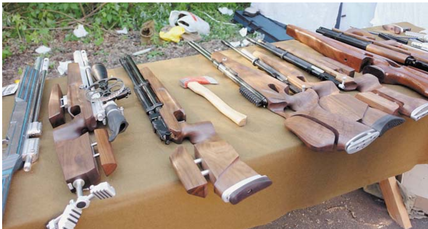
Винтовки производства ООО «Демьян», CZ, AirArms с ложами от фирмы GunStock Dream