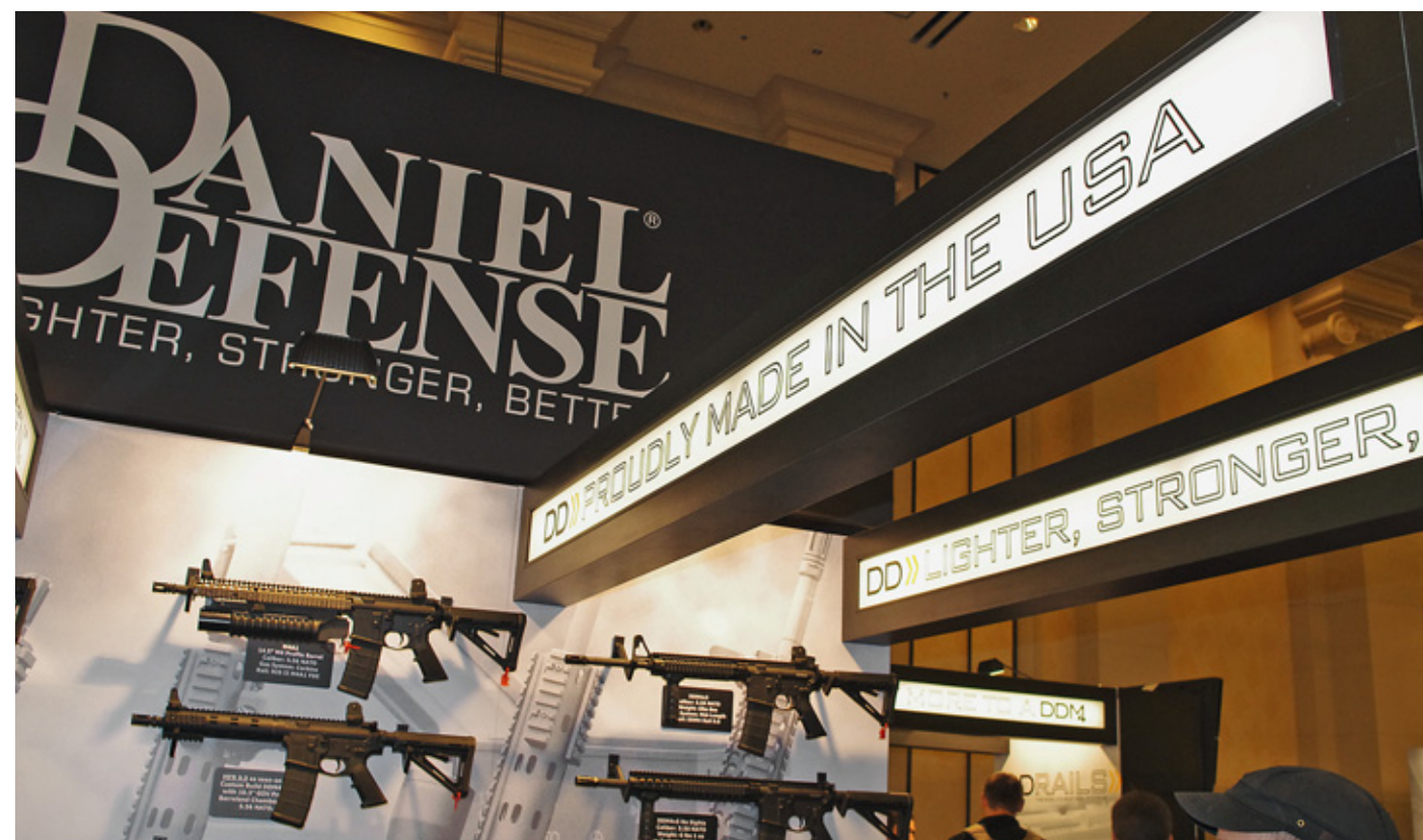
Надпись на фризе гласит «С гордостью сделано в США». В отличие от почти всего остального, китайское оружие до сих пор едва представлено в Америке, хотя в Поднебесной и окрестностях клоны AR-15 штампуются вовсю