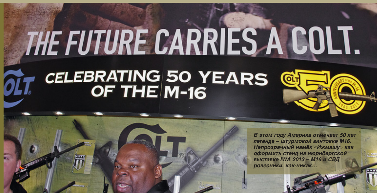
В этом году Америка отмечает 50 лет легенде – штурмовой винтовке M16. Непрозрачный намёк «Ижмашу» как оформить стенд на нюрнбергской выставке IWA 2013 – M16 и СВД ровесники, как-никак...