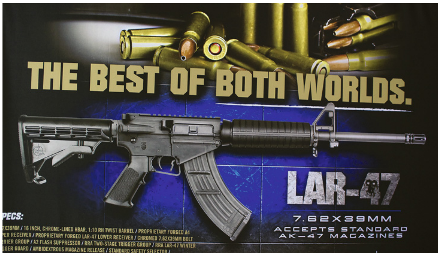
Об этом гибриде (AR-15 калибра 7,62х39 с магазином от АК) я уже писал ранее. Слоган гласит – «Лучшее из двух миров»