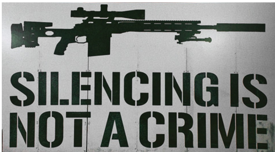
«Тишина (глушение) не преступление» – так рекламируют свою продукцию американские изготовители глушителей