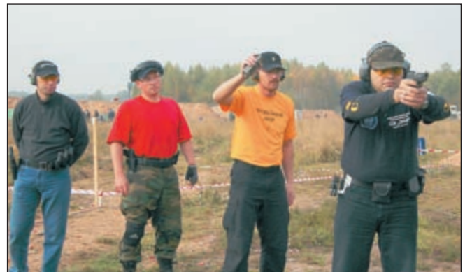
И в Санкт-Петербурге (слева), и в Ярославле всюду стреляли отечественные «Викинги» – первые российские пистолеты, сертифицированные как спортивно-тренировочное оружие