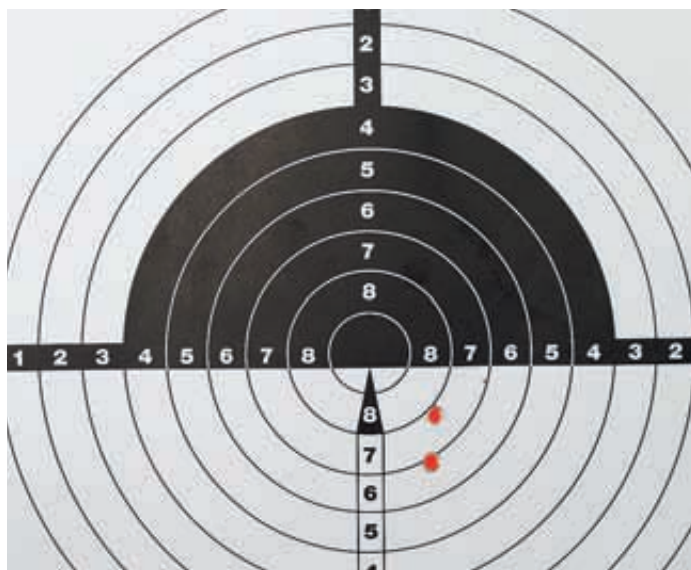
Лучшие результаты отстрела дуплетом штуцеров Silma M 70 Express. Отстрел производился из положения сидя с упора с использованием механического прицела патронами S&B с пулей массой 18,5 г.