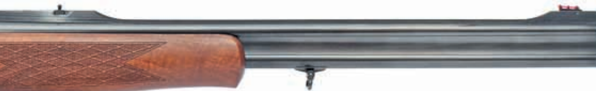
Российский штуцер Silma M 70 Express комплектуется двумя блоками стволов. Стволы в «нарезном» блоке имеют калибр 9,3x74 R, стволы «гладкого» блока 20-го калибра