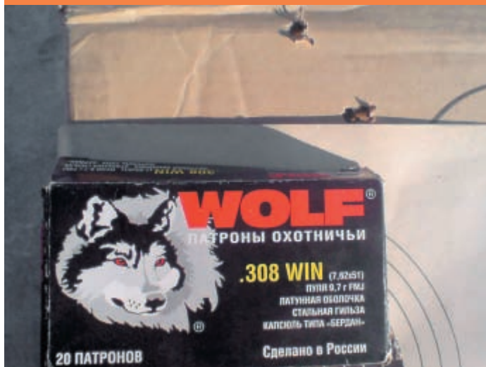
Результаты стрельбы патронами Wolf, Тульского патронного завода