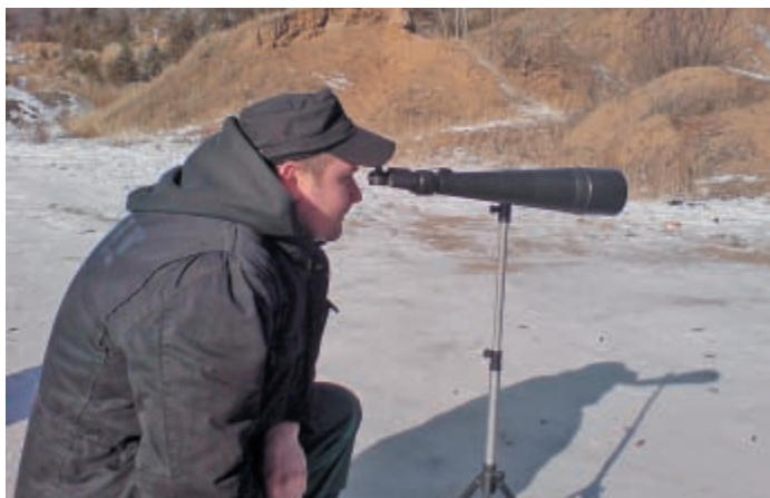
Будущий обладатель карабина внимательно следит за результатами стрельбы

Есть все основания надеяться, что впереди у этого карабина интересная охотничья судьба, о перипетиях которой мы, возможно, расскажем читателям «КАЛАШНИКОВА».