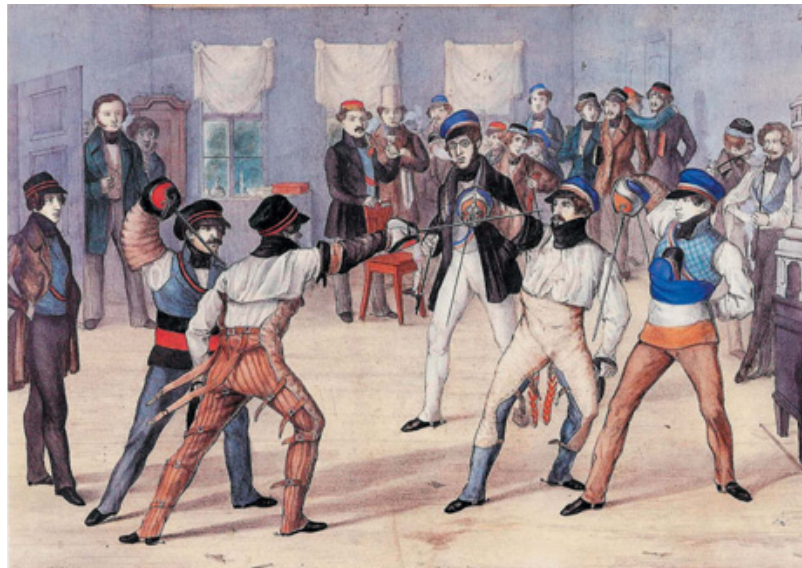
Немецкое мензурное фехтование