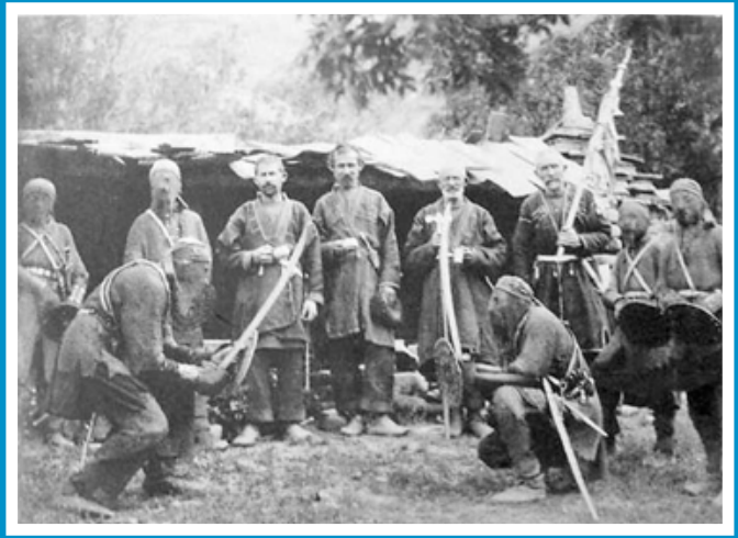
Бойцы парикаоба в полном снаряжении (из книги В. Элашвили)

Пик популярности немецкого мензурного фехтования приходится на конец XIX – начало XX вв. В это время мензурные дуэли докалились даже до Петербурга, где практиковались учащимися Петершule. Угасание традиции наметилось с приходом к власти Адольфа Гитлера, который не любил фехтование и не одобрял независимые молодежные корпорации. Вторая мировая война практически уничтожила эту традицию. Лишь в 60-х годах XX в. силами энтузиастов в Западной Германии началось возрождение немецкой мензуры. Этому способствовало оригинальное отношение властей, которые откровенно попустительствуют незаконному, в общем-то, явлению.