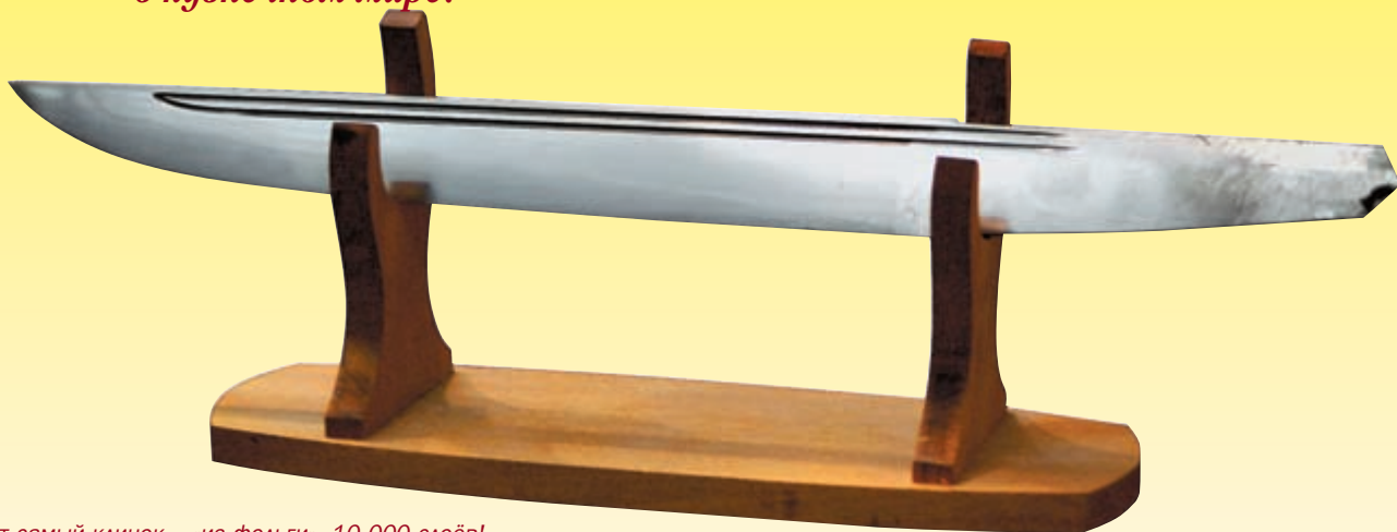
Тот самый клинок – «из фольги». 10 000 слоёв!

Выставка «Клинок. Традиции и современность» (Москва, Центральный дом художников, 19-23 ноября) не закончила выставочную эпопею 2003 года, предварив финал в «Олимпийском» – «Природу, охоту и охотничьи трофеи». Мы решили разнообразить нашу репортажную рубрику и предоставили возможность поделиться своими впечатлениями от выставки двум её участникам. По странному стечению обстоятельств они носят одинаковую фамилию. И не простую, а весьма известную и уважаемую в кузнечном мире.