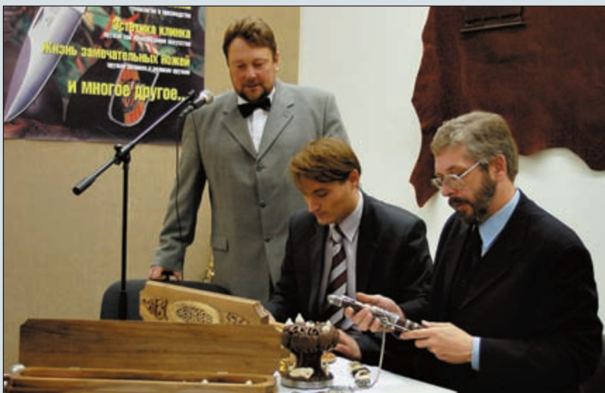
Строгое и компетентное жюри оценивает изделия претендентов на победу в различных номинациях конкурса