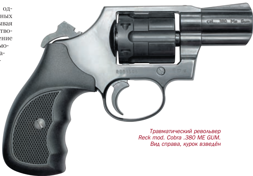
Травматический револьвер Revsk mod. Cobra .380 ME GUM. Вид справа, курок взведён