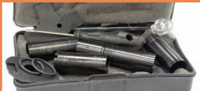
Кроме сменных чоков в комплект Escort'a входят регулировочные прокладки приклада, отвёртка, запасной подаватель магазина и резиновые уплотнения газового двигателя

гребнем приклада ружья Optima Silver Synthetic также выглядит весьма привлекательно и, в то же время, достаточно оригинально. Уже упоминавшаяся выше система Triорad использована и в конструкции затильников прикладов исполнений Silver Select и Silver Synthetic.