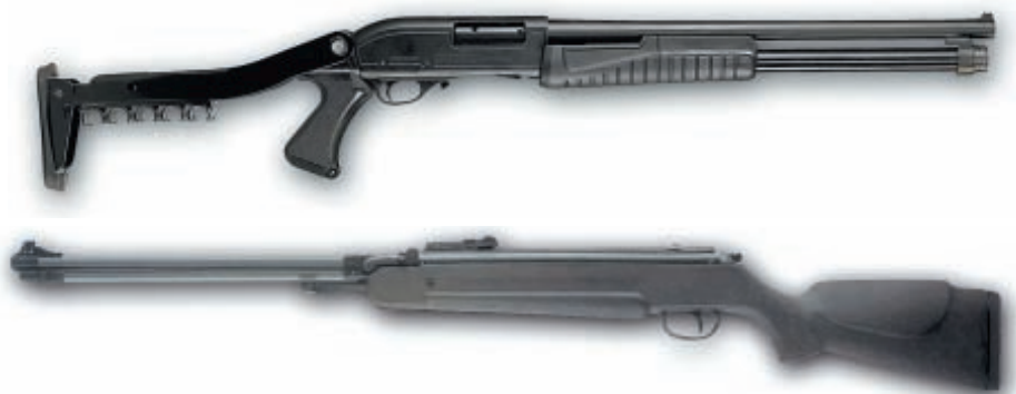
Продолжаются поставки в Россию помповых ружей Hatsan, а также широкой номенклатуры пружинно-поршневого пневматического оружия этой фирмы