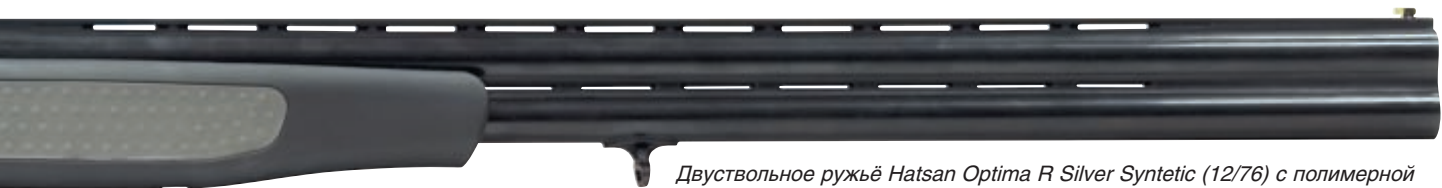
Двуствольное ружьё Hatsan Optima R Silver Syntetic (12/76) с полимерной ложей с регулируемым гребнем приклада комплектуется 5 сменными чоками