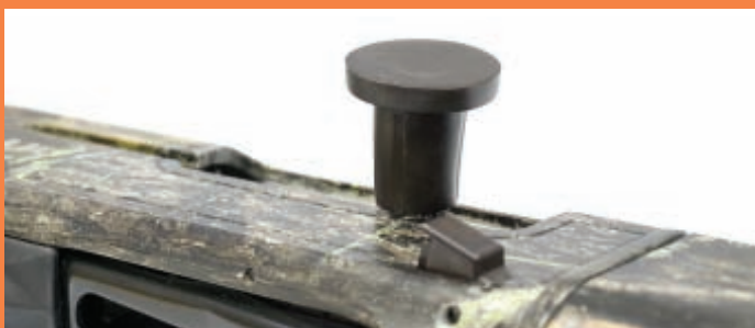
Ружья Escort поставляются с предохранительным пластиковым колпачком, который может надеваться на рукоятку затвора. Это сделано для того, чтобы не повреждать чехол или поролоновую вставку футляра при транспортировке. Мелочь, а приятно