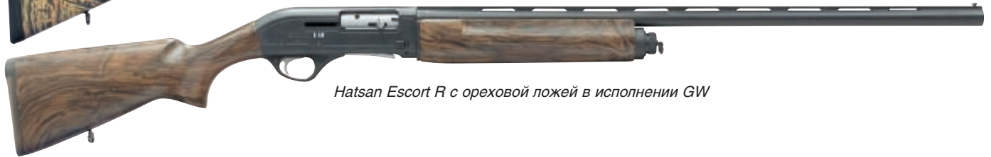
Hatsan Escort R с ореховой ложей в исполнении GW

конструкторы Hatsan Arms Company решили сразу две важные задачи, обе направленные на создание более комфортных условий для стреляющего. Это, как уже говорилось, эффективное уменьшение воздействия энергии отдачи, а также возможность регулировать толщину затыльника, тем самым, в определённых пределах, изменяя габаритные размеры ружья, подбирая их под анатомические особенности отдельного человека.