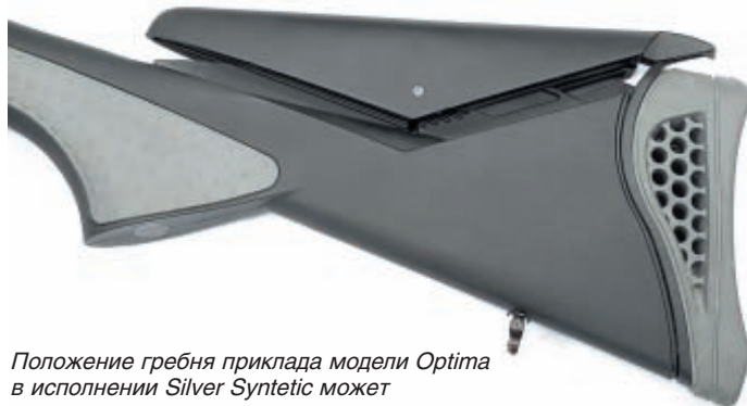
Положение гребня приклада модели Optima в исполнении Silver Syntetic может регулироваться по высоте в широком диапазоне, обеспечивая удобство индивидуальной подгонки оружия

Теперь более подробно остановимся на конкретных моделях охотничьего оружия производства Hatsan Arms