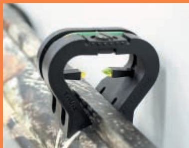
В исполнении Combo модель Escort комплектуется довольно дорогими прицельными аксессуарами фирмы Hi-Viz, повышающими удобство прицеливания