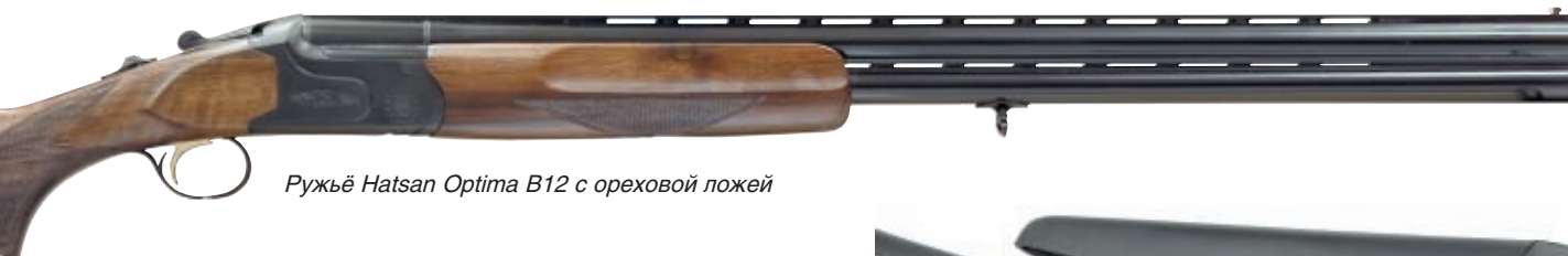
Ружьё Hatsan Optima B12 с ореховой ложей

Производственные мощности компании, в которой трудятся 350 квалифицированных сотрудников, располагаются на площади 15 км 2 . Парк оборудования состоит из более 300 современных станков, включая современные обрабатывающие комплексы, которые обеспечивают практически все стадии технологического процесса, включающего металло- и деревообработку, ствольное производство, термообработку, сварочные и ковочные операции, химическую обработку поверхностей, лазерное гравирование на металлических и деревянных частях изделия, технологию камуфляжного покрытия поверхностей и многое другое.