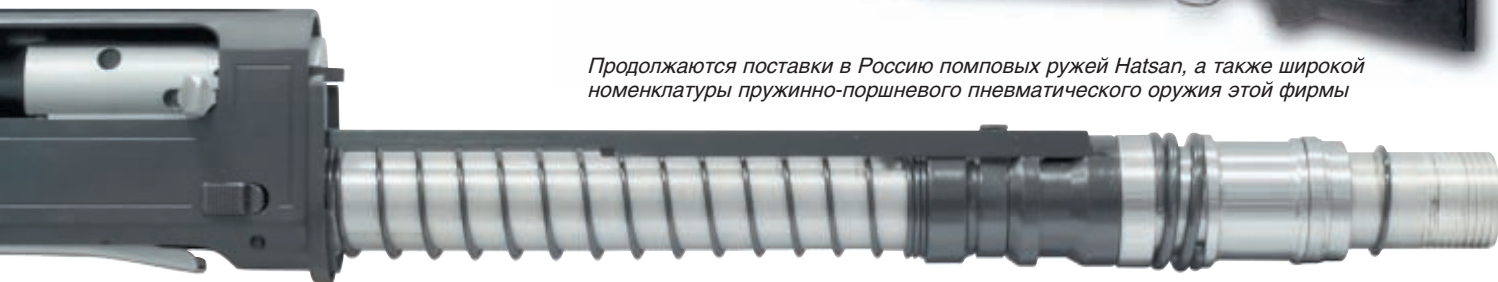
Газовый двигатель модели Escort имеет обычную, проверенную временем конструкцию