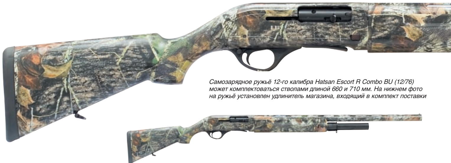
Самозарядное ружьё 12-го калибра Hatsan Escort R Combo BU (12/76) может комплектоваться стволами длиной 660 и 710 мм. На нижнем фото на ружьё установлен удлинитель магазина, входящий в комплект поставки

Сотрапу, представленных на российских оружейных прилавках. Несомненно, визитной карточкой этой фирмы являются ружья Escort. К слову, эта модель уже давно знакома отечественным любителям оружия, поскольку несколько лет назад именно она (в паре со Stoeger-2000) открывала «парад турецкого оружия в России». По этой причине, эти ружья обратили на себя чрезмерно пристальное внимание специалистов-оружейников практически на всех стадиях их оборота (от таможни до покупателя). Цена оптовых продаж широкой гаммы этих полуавтоматов не превышает 10-12 тысяч рублей, что ставит эту модель в первые ряды оружия эконом-класса. Достаточно большое количество заядлых охотников и просто любителей оружия имели возможность лично познакомиться с ружьями Escort, испытав их в различных условиях эксплуатации. Независимо от того, какие патроны использовались при испытаниях (отечественные или импортные), ружья Escort зарекомендовали себя надёжными и стабильными.