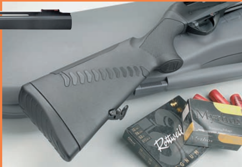
Приклад ружья, выполненный по технологии Comfortech