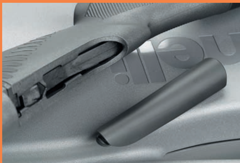
Сменный гребень приклада ружья Comfort