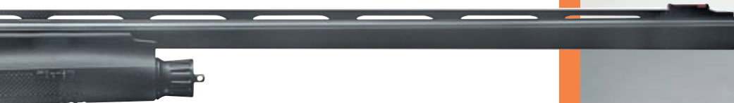
Benelli Raffaello CrioComfort

ощущаемой отдачи оказывает влияние и полиуретановый затыльник, значительно увеличивающий контактную поверхность с плечом при выстреле. Сменный гребень приклада кроме подбора оптимальной величины возвышения глаза стрелка и совмещения его оптической оси с линией прицеливания, амортизирует вибрации при стрельбе. Это также эксклюзивная разработка Benelli Armi.