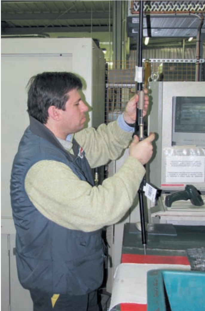
Сборочный цех и сегодня не может обойтись без ручного труда

Benelli 121 с инерционным затвором. Следующая, более совершенная модель SL 80, появляется в 1978 году. В ней был установлен ударно-спусковой механизм новой конструкции, использован ствол из Брешии (вместо ствола от французской «Манюфранс» из Сент-Этьена), более мощная возвратная пружина и применено новое покрытие ствольной коробки.