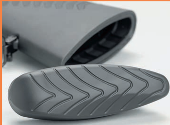
Сменный затыльник приклада ружья Comfort