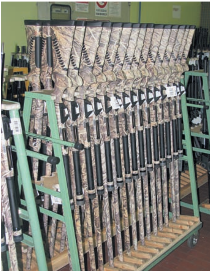
Камуфлированные «Комфорты» в конце сборочного цикла

В 1985 году, т. е. два года спустя после презентации модели Montefeltro, компания выпускает версию Super 90, которая вобрала в себя очередные усовершенствования. Был разработан, испытан и внедрён подающий механизм новой конструкции селективного типа, вместо старого, инерционного; введены прокладки и вставки для изменения степени погиба приклада, гайка цевья стала более удобной и эстетичной. Изменения также коснулись затворной группы, цевья, приклада и даже рукоятки затвора. Строго говоря, Super 90 не было новой моделью, а стало логичным завершением стилистической линии ружей Montefeltro. Сегодня мы видим такие ружья этой линии, как Montefeltro Beccacia, Duca di-Montefeltro 12-го и 20-го калибров, вплоть до Benelli Comfort (также на базе Montefeltro).