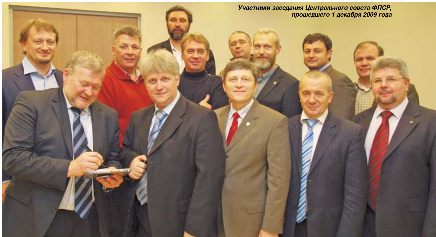
Участники заседания Центрального совета ФПСР, прошедшего 1 декабря 2009 года