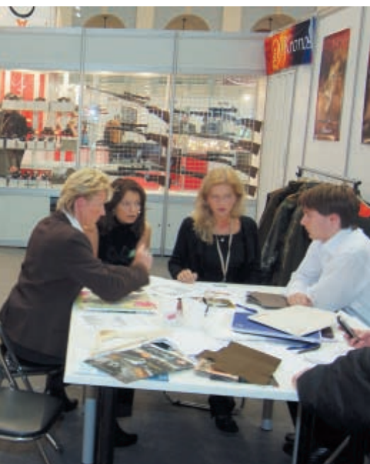
деловые переговоры. На фото экспозиция