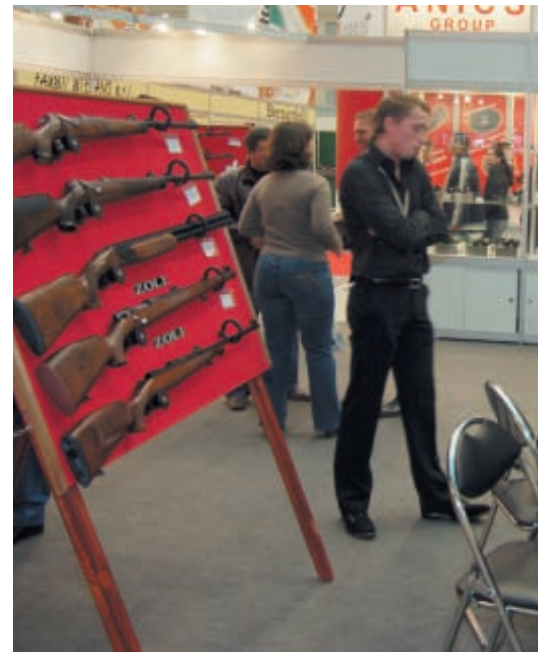
Почти на каждом стенде каждый день проводились презентации петербургской фирмы «Атташе»