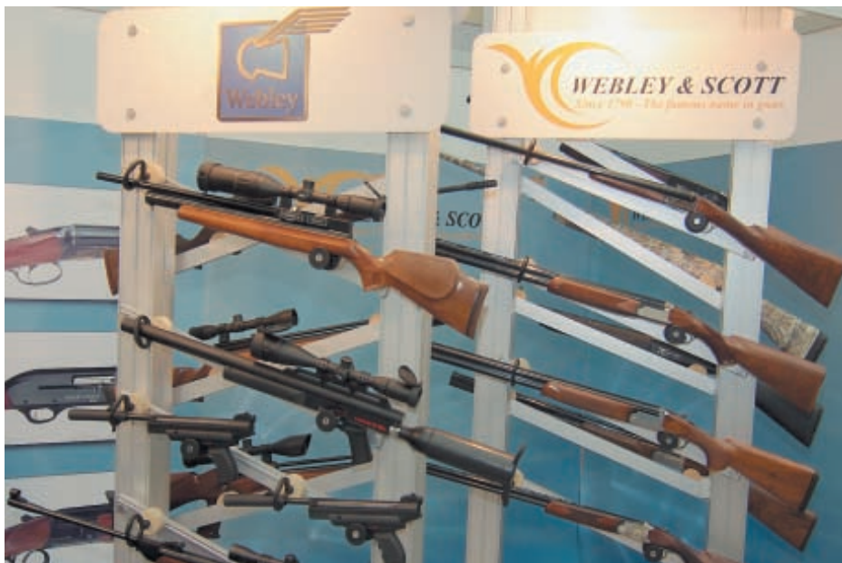
Мы думаем, что некоторые образцы ружей и пневматики «Веблей-Скотт» скоро появятся в продаже

более 500 человек, он оказался неформальным центром живого общения сотрудников редакции со своими читателями, на что и обратил внимание сам Михаил Тимофеевич Калашников при его посещении.