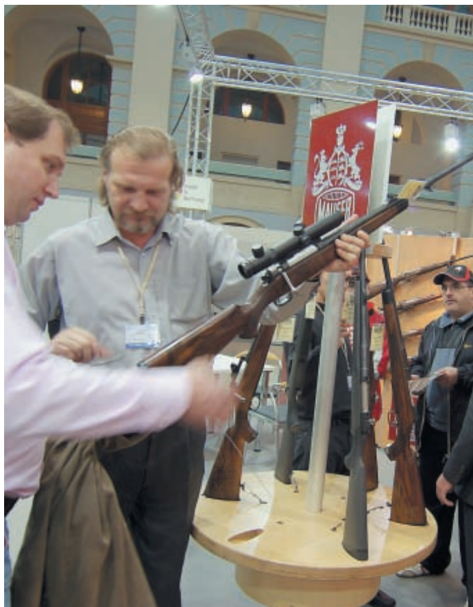
Практически все экспонаты, включая оружие, демонстрировавшееся на выставке, можно было брать в руки и получать исчерпывающие консультации специалистов

Приятный сюрприз для российских охотников на московской выставке приготовил Тульский оружейный завод и показал новое одноствольное магазинное ружьё калибра 12/76 с отделяемым магазином на 2 патрона, модель ТОЗ-124. Ружьё было любезно предоставлено для осмотра, а его конструктор с большим вниманием отнёсся к предложениям по вариантам длины ствола этого интересного ружья, возможности быстрой замены магазина, поставки запасных магазинов, установки механического прицела для быстрой стрельбы в лёт и др. Опыт подсказывает, что обе эти новинки – новая самозарядка «Пеликан» завода «Молот», как и магазинка с продольно-скользящим поворотным