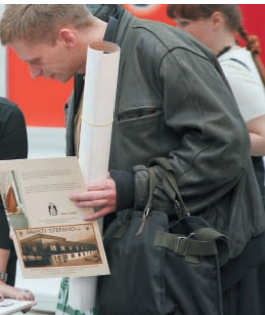
Получить фирменный плакат с автографом самой