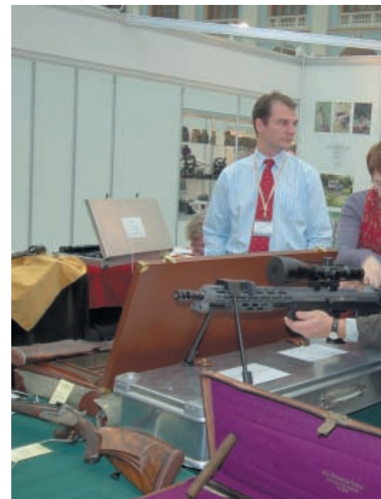
На московской выставке среди охотничьего оружия и для снайперского эксклюзива