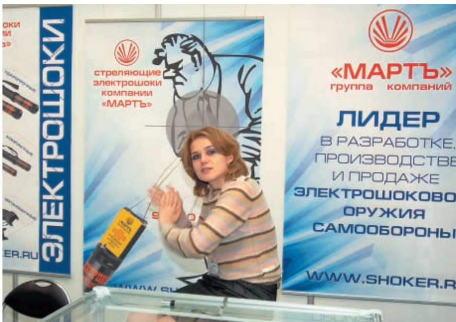
Почтил своим вниманием «Оружие и охоту» и ведущий российский производитель электрошокового оружия самообороны – фирма «Март»