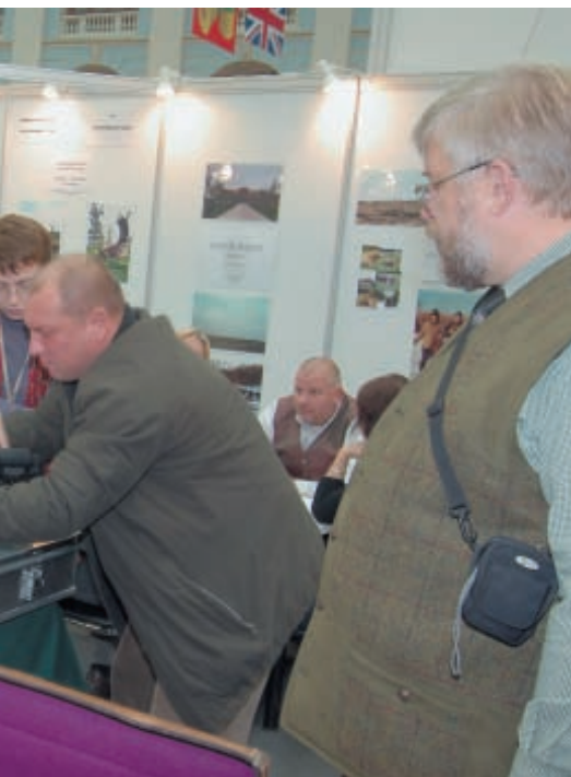
индивидуального изготовления нашлось место