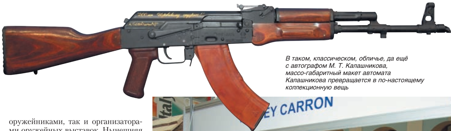
В таком, классическом, обличье, да ещё с автографом М. Т. Калашникова, массо-габаритный макет автомата Калашникова превращается в по-настоящему коллекционную вещь