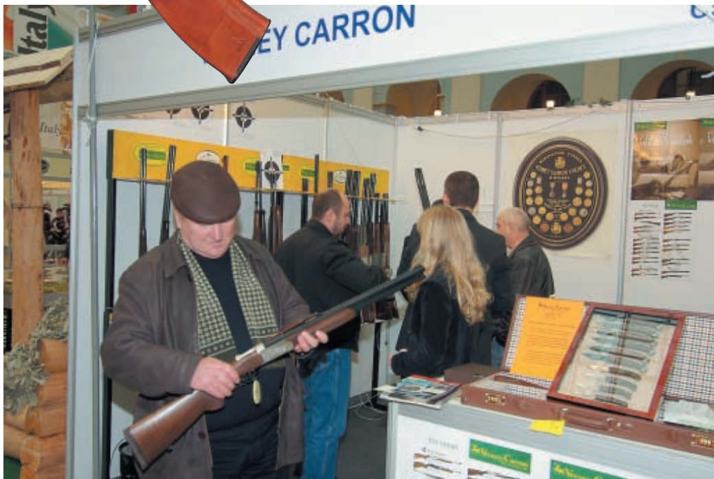
Странно, что французская фирма Verney Carron никак не может занять достойное место на российском оружейном рынке. А ведь в Европе эту старую и уважаемую марку знает каждый охотник

Все дни работы выставка отличалась подчёркнуто деловым характером, когда экспоненты хорошо ориентируются в особенностях конъюнктуры оружейного рынка и с учётом этого строится вся их деловая активность. Это было характерно как для многих зарубежных компаний, так и для уже ставших постоянными их российских партнеров. И те и другие на выставке успешно реализовывали свои намерения, вели переговоры на деловых встречах, продлевали старые или заключали новые торговые соглашения. На стендах зарубежных компаний редко уже можно было видеть вальяжно расположившихся оружейников в ожидании манной