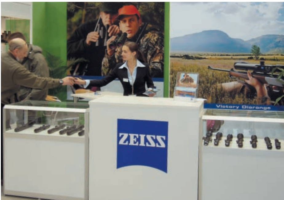
«Цайс» традиционен – всё функционально и доброжелательно

Из других особенностей выставки можно отметить присутствие на ней различных средств массовой информации, в том числе оружейных и охотничьих журналов. Наш родной «КАЛАШНИКОВ» был представлен на красочно оборудованном стенде, где размещались репродукции редких художественных картин с сюжетами царских охот в Гатчине, Лисино и Беловежской пуще. Стены стенда украшали старинные охотничьи ружья начала и середины XIX в. с кремневыми замками. Активная просветительская работа у этого стенда ни на минуту не прекращалась все четыре выставочных дня. По приблизительным подсчётам стенд журнала посетили