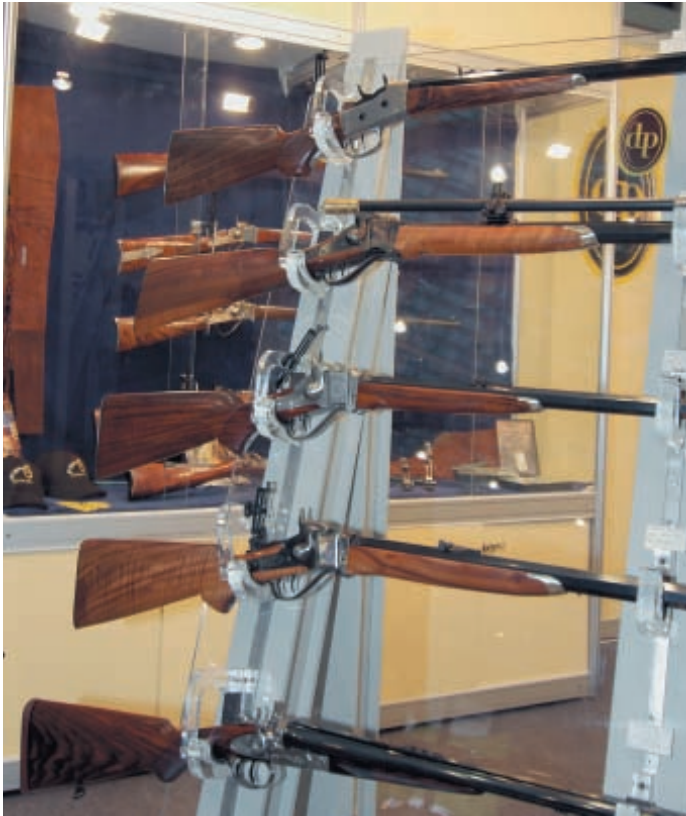
Итальянцы из фирмы Pedersoli видят перспективы для своего бизнеса в России, несмотря на то, что занимаются выпуском не традиционного охотничьего оружия, реплик кремнёвых и капсюльных ружей. Первые образцы уже сертифицированы как охотничье оружие в полном соответствии с действующим законодательством

небесной и напора российских бизнесменов... Деловитость и ещё раз деловитость. В этом плане московская выставка становится чем-то похожей на итальянскую Еха в Брешии, но превосходит её российским колоритом.