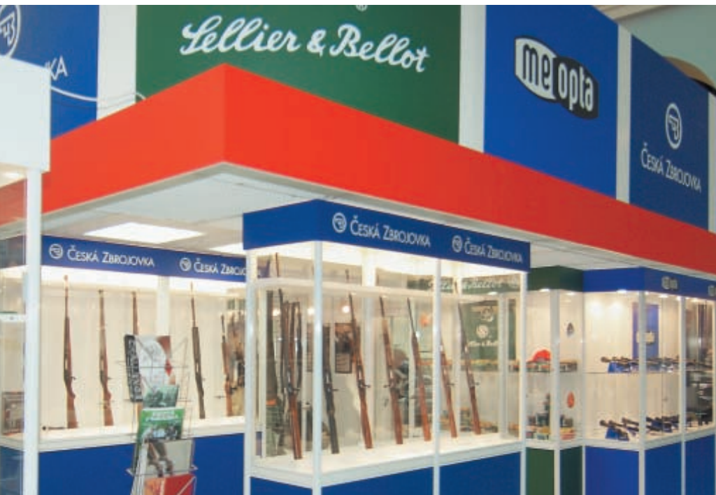
Чешские производители охотничьего и спортивного оружия, оптики и боеприпасов собрались в один кулак на стенде петербургской фирмы «Альянс» (оружейный магазин «Охотник на Большом»)

Казалось бы, это в равной мере должно относиться и к нашим крупнейшим оружейным заводам, которые вот уже несколько последних лет, мягко говоря, не блещут выставочными новинками и ещё реже – производственными. Изредка появляющиеся опытные образцы затем долгое время экспонируются как новшества, пока не выйдут на конвейер. В отношении таких «новинок» всё чаще можно слышать термин, раскрывающий ставшую крылатой аббревиатуру ВВМ как «вечные выставочные модели». Иногда такие инновационные модели