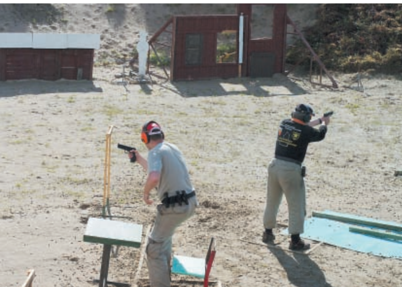
Планировка площадок допускала одновременное выполнение упражнения двумя стрелками даже с перемещением и стрельбой в движении

в количестве 67 штук (два с лишним пистолета на одного курсанта, однако). Было, из чего выбрать... По совету Виталия Крючина я взял Grand Power K-100, получив к нему соответствующую кобуру, а также пояс, подсумки, четыре магазина и ускоритель зарядания.