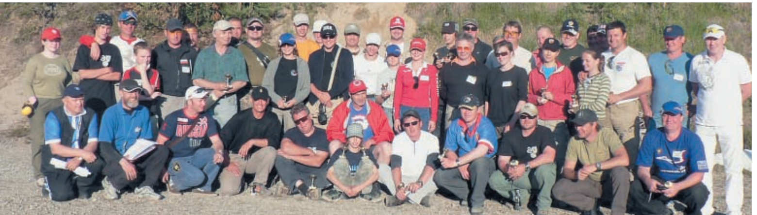
Участники последней смены курсов по практической стрельбе из пистолета в Суомусалми