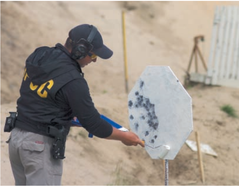
Мишени на площадках подкрашивались при смене групп