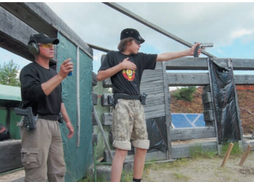
Несовершеннолетие практической стрельбе не помеха