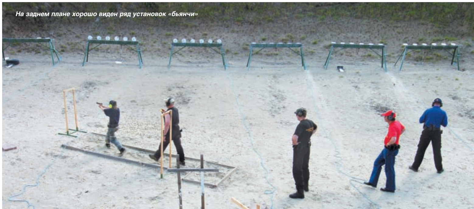
На заднем плане хорошо виден ряд установок «бьянчи»