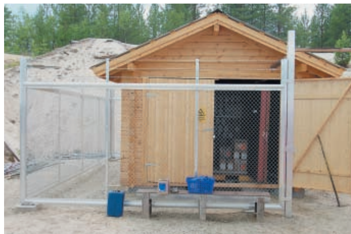
67 пистолетов перемещаются по территории Финляндии в багажнике, надёжно упакованные в «бронированные» пластиковые корытца с фанерными крышками на навесных замочках. А на снимке справа хранилище на 200 000 патронов, оборудованное прямо в лесу на стрельбище. Кстати, на мой взгляд, аналогии с Россией неуместны – для того, чтобы жить как финны, надо быть финнами