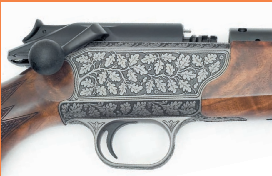
Карабин Blaser R 93 в исполнении Attache выглядит очень гармонично. Учитывая своеобразный дизайн этой модели немецким художникам пришлось потрудиться для того, чтобы угодить довольно консервативным европейским охотникам. Ну, а для придания большей индивидуальности будущий владелец R93 может заказать оружие с собственной монограммой (на фото слева)

Если, допустим, рассматривать новейшую отечественную оружейную историю (со второй половины XX-го века), то нам стыдиться нечего. Практически все, даже самые простые и недорогие серийные модели охотничьего оружия всегда выпускались не только в ординарном металодеревянном исполнении, но и в различных украшенных вариантах. Декор мог заключаться и в скромной виньетке на колодке, и в насыщенном орнаменте, и в глубокой резьбе по металлу и дереву с охотничьими сценами, дополненной серебряной вставкой и инкрустацией перламутром. В этом смысле особенно преуспели оружейники Тульского оружейного завода, не прекращавшие выпуск украшенных исполнений даже в труднейшие 90-е годы. Всё это время в тени незаслуженно находилась ижевская школа украшения оружия, как будто работавшая сама на себя, поскольку серийные ИЖИ удачными оформительскими изысками не отличались. Всяческих похвал заслуживает ЦКИБ СОО (в своём недавнем прошлом). «Цкибовские» мастера были способны в лучшем виде удовлетворить высокий вкус и европейского монарха, и страсть арабского шейха к блестящим позументам.