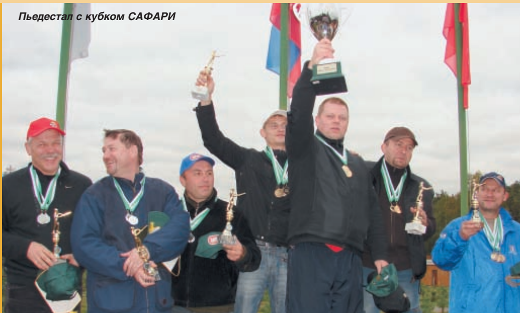
Пьедестал с кубком САФАРИ

В марте стартовал трёхэтапный кубок «Safari-Professional», проводимый подмосковной фирмой «Магнум-К», которая производит патроны для гладкоствольного оружия под маркой «Safari-Professional». В июле состоялся второй этап. И вот в сентябре на стрелковом комплексе «Бисерово – спортинг» прошёл заключительный – третий. За это время и стрелки прибавили в классе, и фирма получила большую известность. Огромная работа проделана для популяризации стрелкового спорта. Более чем на десяти турнирах в различных регионах России: Якутске, Кирове, Самаре, Магнитогорске, Москве на флагштоках стрелковых комплексов поднимались флаги с надписью «Safari-Professional».