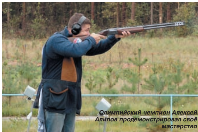
Олимпийский чемпион Алексей Алипов продемонстрировал своё мастерство

Награждение призёров и победителей проводилось представителями «Магнум-К» и партнёров фирмы. Призы были предоставлены ООО «Ижевские Ружья», Ижевск; ЗАО «Климовский специализированный патронный завод»; ООО ЦПП «Гранд-Охота», Химки; оружейным салоном «Арсенал», Тольятти; ЗАО «Кольчуга», Москва; ООО «Росхантер», Москва и, разумеется, фирмой организатором. Общий призовой фонд составил более 500000 руб.