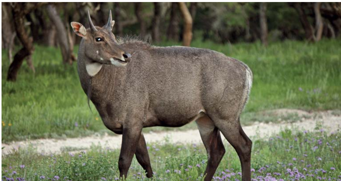
Нильгау, уроженец Индии и Пакистана, в изобилии водится на многих ранчо в южном Техасе. Этот молодой бычок был сфотографирован на ранчо RecordVick близ городка Утопия в Техасе

ткани, остановившись под шкурой прямо у задней ноги. Я извлекла обе пули и убедилась, что они отлично сработали. Нильгау знамениты тем, что они крепки на рану, но весь секрет состоит, разумеется, в хорошей пуле (или двух), посланной в нужное место.