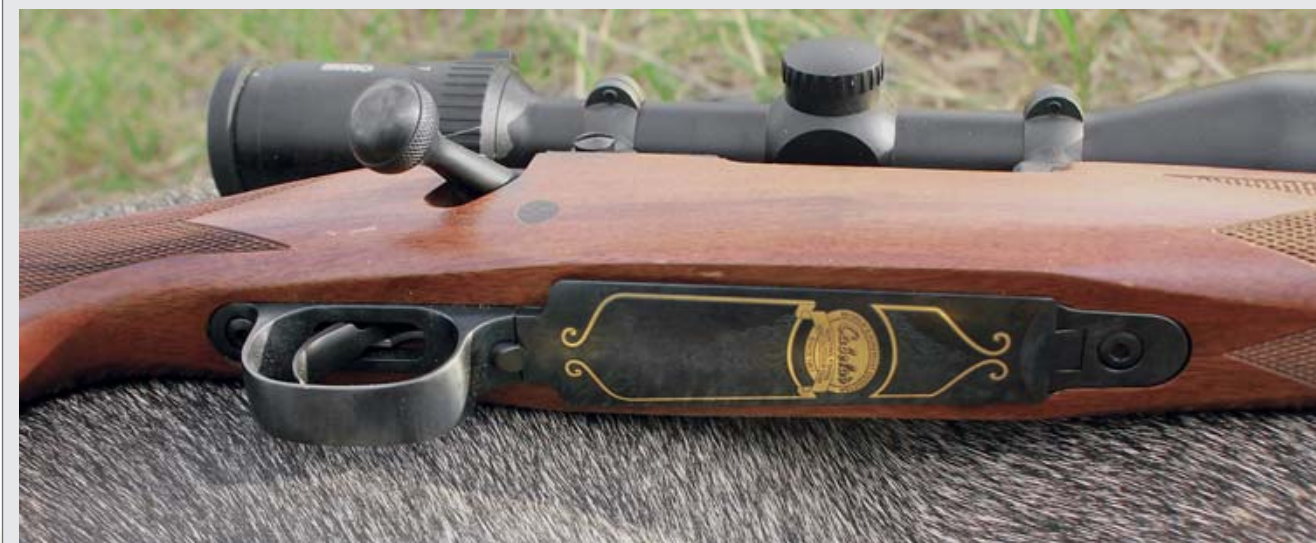
На крышку магазинной коробки винтовки нанесена гравировка и логотип Cabela's.