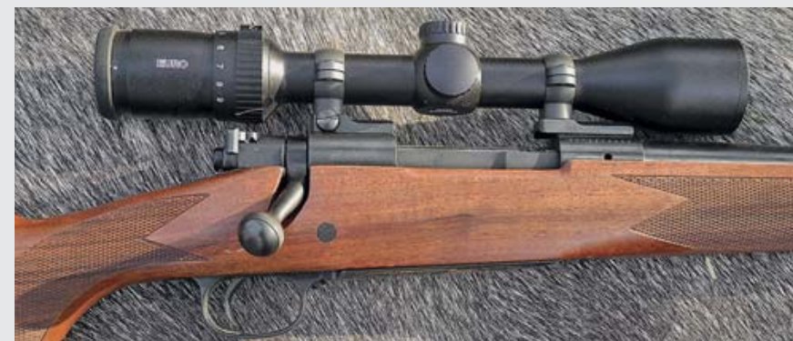
Будучи одной из винтовок линии Cabela's Custom Classics, эта 70-я модель калибра .264 Winchester Magnum, оснащена великолепной ореховой ложей III класса и изукрашенной рукояткой затвора. Оптический прицел – модели Cabela's Euro 3-9x42.

Я впервые стреляла из модели калибра .264 Winchester Magnum – классического калибра для равнинной дичи,