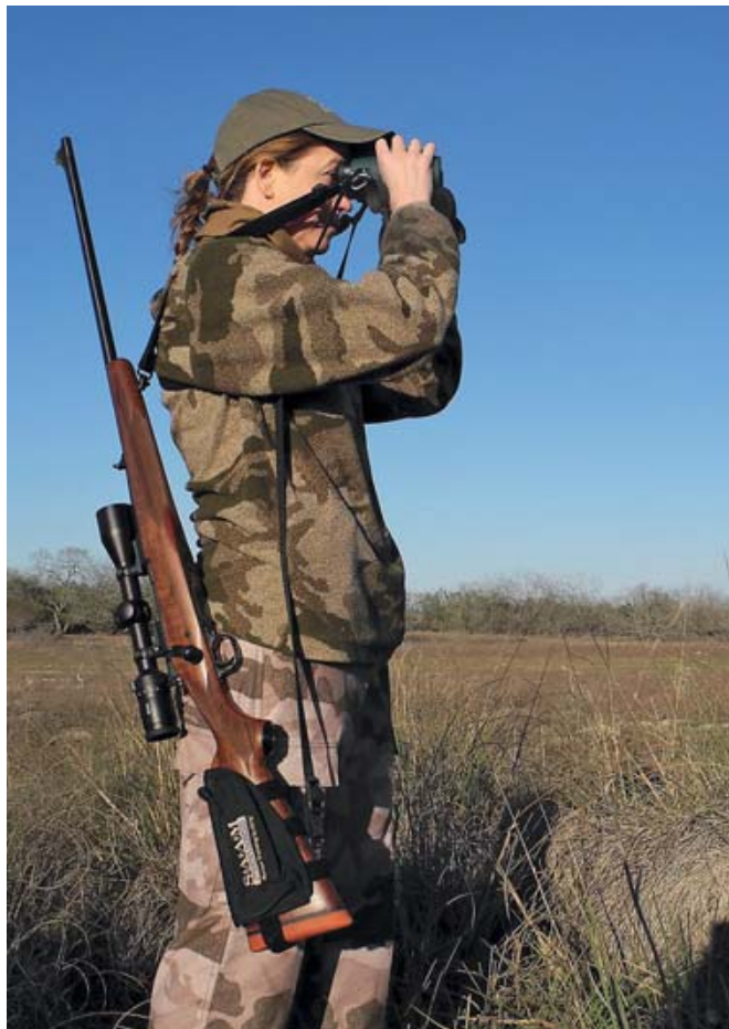
На ранчо Кинг предлагается отменная охота на вольную дичь: нильгау, белохвостого оленя, дикого кабана, пекари, дикого индюка и перепёлку