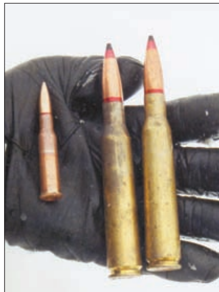
Крупнокалиберная винтовка В-94, находящаяся на вооружении «Кречета», оснащена 13-кратным прицелом с мощной широкоугольной оптикой. Теперь бойцы имеют в своем распоряжении и новый снайперский патрон калибра 12,7х108, оснащённый специальной пулей массой 56 г. Начальная скорость пули 730 м/с