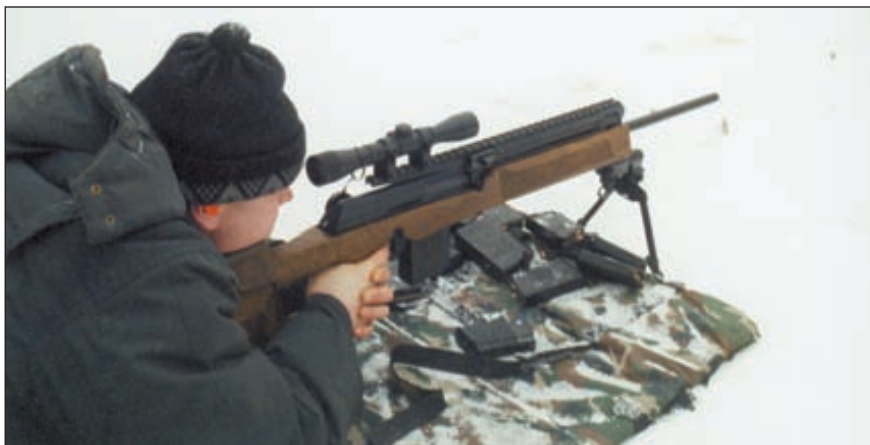
В качестве оружия передовой огневой поддержки предложена самозарядная винтовка «Вепрь-Супер-Спорт» под патрон 7,62x51 (.308 Winchester)