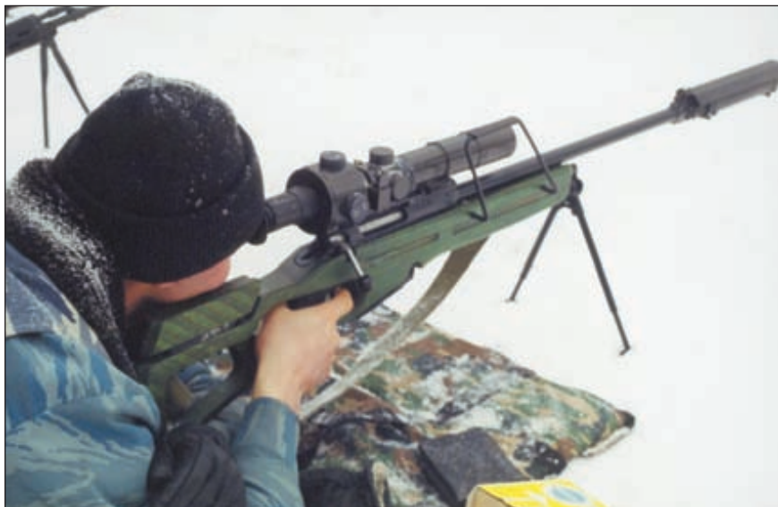
СВ-98 – новая снайперская винтовка специального назначения. Винтовка оснащена прицелом «Гиперон», который, по мнению специалистов, является последним словом в области снайперской оптики

Однако деятельность «Ижмаша» не ограничивается только поставками новых образцов вооружения. Тесные дружественные связи сложились с отрядом спецназа «Кречет» УИН Минюста России по Удмуртской Республике. Сотрудники завода находятся в постоянном рабочем контакте с бойцами, прислушиваются к их мнению, замечаниям и предложениям, вносят соответствующие изменения в конструкцию. Это позволяет максимально точно адаптировать образцы к требованиям сил специального назначения. «Ижмаш» проводит встречи ведущих конструкторов-оружейников с бойцами отряда, на которых любой из спецназовцев может получить исчерпывающую консультацию по самому широкому спектру вопросов. Новым направлением в работе предприятия является проведение совместных теоретических и огневых учений, где бойцы обучаются наиболее эффективным способам применения новых видов стрелкового