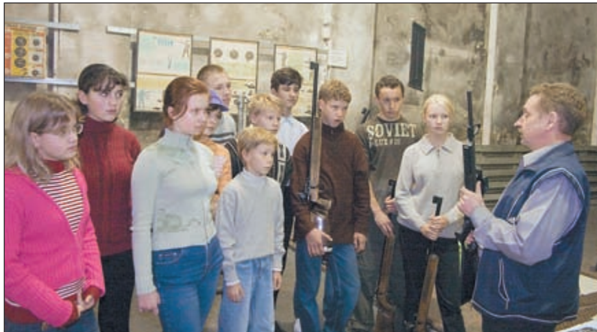
Ребята из спортивной секции «Русское оружие» (Санкт-Петербург) знакомятся с иностранной новинкой