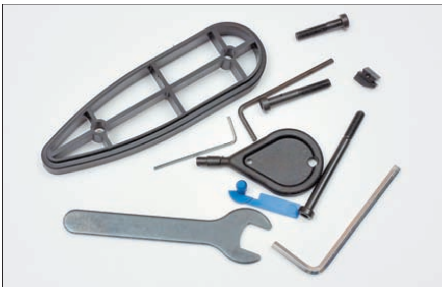
Принадлежности из комплекта поставки карабина Walther G22. В центре специальный ключи от замка спускового крючка

Такой набор предохранительных устройств продиктован неплохой подготовкой потенциального пользователя. В большинстве зарубежных стран уровень оружейной