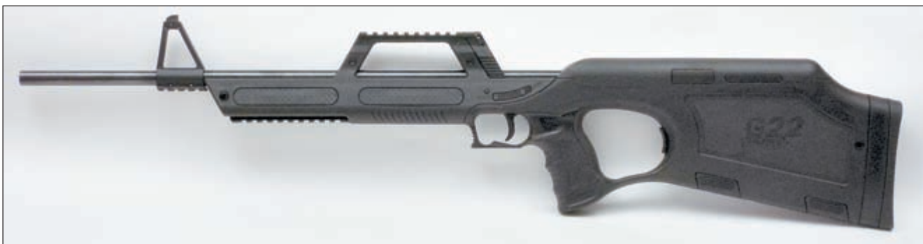
Самозарядный малокалиберный карабин Walther G22. В Россию модель поставляется с удлинённым стволом, так как оригинальное изделие имеет общую длину всего лишь 720 мм и не вписывается в действующие нормы (свыше 800 мм)

Я первый раз в жизни столкнулся с таким популярным личным восприятием отдельно взятой модели оружия. Мне с первого взгляда радикально не понравился внешний вид «насквозь» пластмассового «Вальтера» с тяжёловесной кормой и непропорционально худой передней частью. И я с удивлением наблюдал маниакальные попытки своего товарища купить один из первых карабинов, поступивших в Россию, не без оснований считая наши оружейными вкусы весьма схожими.