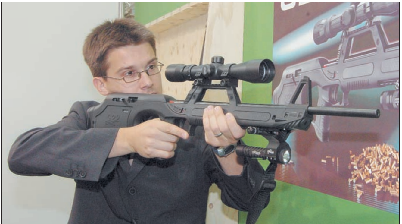
Walther G22 демонстрировался на выставке «Оружие и охота 2005» на стенде немецкой фирмы Umarex в полном комплекте – с оптическим прицелом, тактическим фонарём и лазерным целеуказателем

магазина. Кнопка защёлки магазина спрятана внутри выреза в прикладе хорошо защищена от случайного нажатия. Второй, запасной магазин хранится в прикладе, позади основного магазина. Длина приклада может изменяться установкой проставок различной толщины (в комплекте идёт одна дополнительная 20-мм). Поскольку «булпапы» традиционно неудобны для левшей, в G22 предусмотрена возможность изменения направления