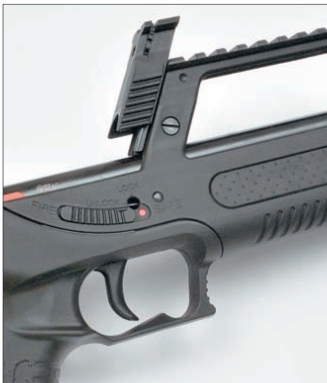
Для прицеливания с помощью механического приспособления колодку целика необходимо перевести в верхнее положение. На фото предохранитель выключен, дополнительный замок открыт

Walther G22 - это самозарядный карабин калибра .22 LR, построенный по схеме «булпап». Как и у всех распространённых малокалиберных полуавтоматов, автоматика «Вальтера» работает за счёт отдачи свободного затвора. Возвратных пружин две. Питание патронами осуществляется из 10-зарядного