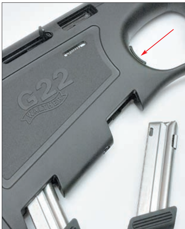
В прикладе карабина предусмотрено гнездо для запасного магазина. На фото магазин, из которого осуществляется питание патронами извлечён. Стрелкой показана кнопка защёлки магазина