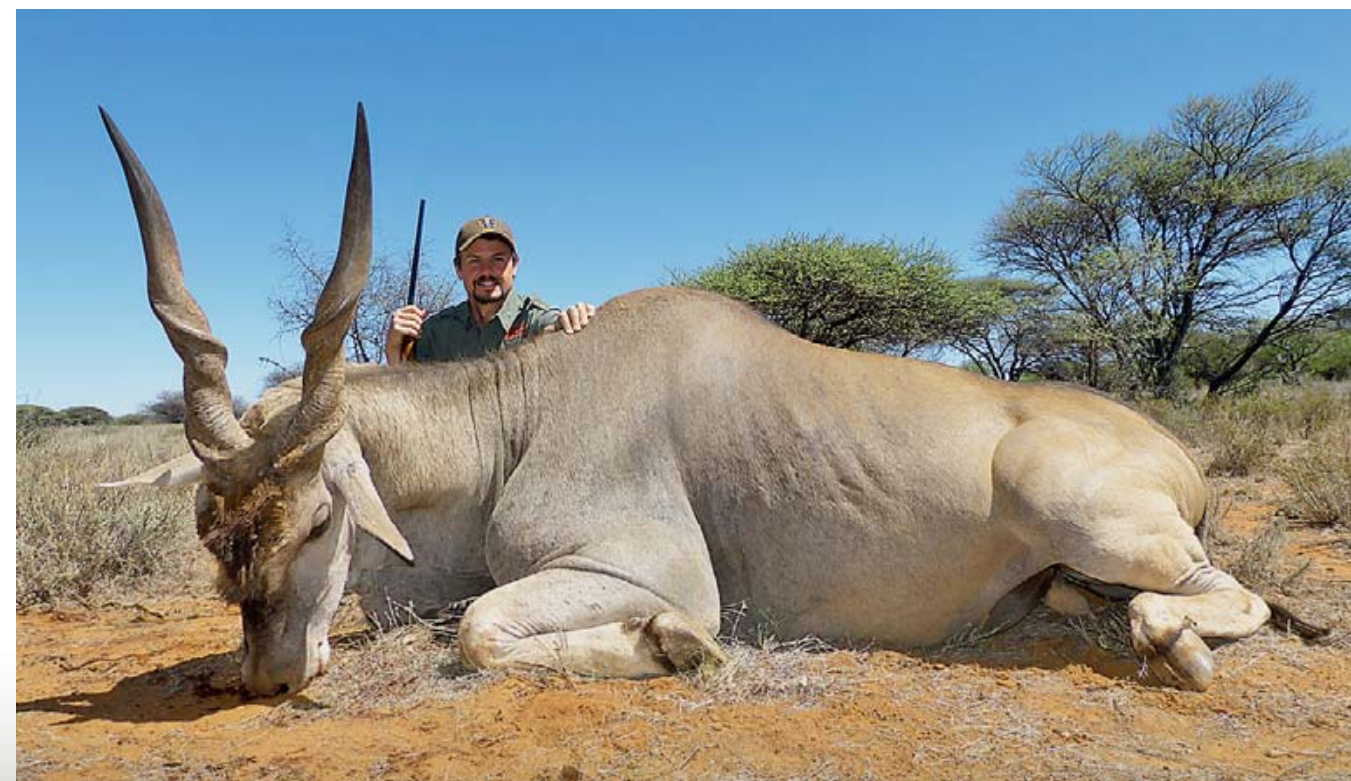
У этого громадного матёрого быка канны было всё, что требовалось, – основательный подгрудок, косматый «чуб», шкура воронёного оттенка и длинные тяжёлые рога

Мы все заметили друг друга почти в одно и то же мгновение. Казалось, бык канны не был уверен в том, кто мы такие, и решил просто разглядывать нас, пока не решит, что мы из себя представляем. Вскоре мы обнаружили и другого бычка, но не могли рассмотреть ни шкуру, ни шерсть быка-здоровья. Второй самец обретался на лёжке, так что мы предположили, что матёрый бык – тоже на лёжке. Наконец, после весьма некомфортальных полутора часов, я шуточно шепнул Айвэну: «Да ну всё это к ляду, я сейчас просто пристрелю его!»