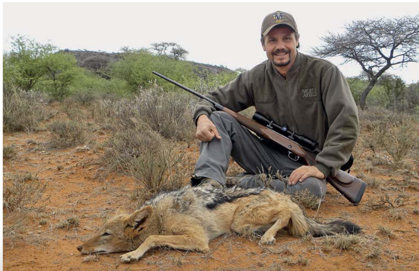
А этот недурной чепрачный шакал, добытый после канны, оказался неплохим бонусом