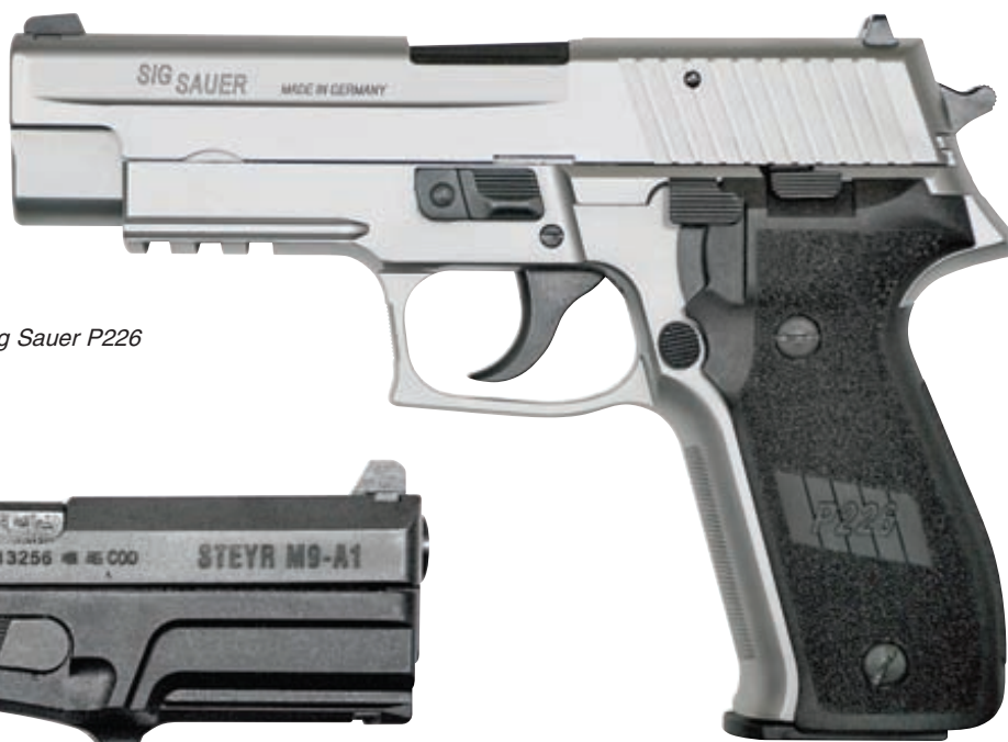
9-мм пистолет Sig Sauer P226

В связи с появлением довольно большого числа новых иностранных моделей, на мой взгляд, в ближайшем будущем возможно некоторое падение внутреннего спроса на «Викинги». С учётом значительной стоимости «иностранцев» (CZ – около 40000 руб., Steyr – около 50000 руб., Sig Sauer – около 100000 руб.), на обновление парка ижевских пистолетов у клубов просто не останется денег. Кроме того, не будет и желания тратить средства на «плохие» российские пистолеты, пока не пройдёт первая