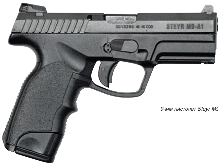
9-мм пистолет Steyr M9-A1