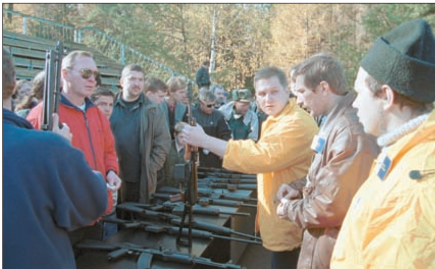
На все вопросы гостей фестиваля отвечали члены клуба «Сайга» и представители Ижевского оружейного завода

Не вызывает сомнения тот факт, что наряду с олигархами, коррупцией и прочими «символами» нашей действительности, оружие легко может быть выбрано в качестве очередного «жупела» для предвыборной компании. Сегодня механизм такой, четко направляемой и подогревае-