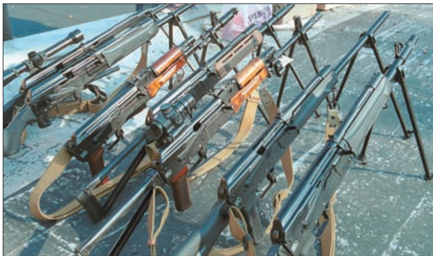
В чём не было недостатка на фестивале, так это в «Сайге». Любые калибры и модификации дополнялись различными аксессуарами – сошками, оптическими прицелами, лазерными целеуказателями