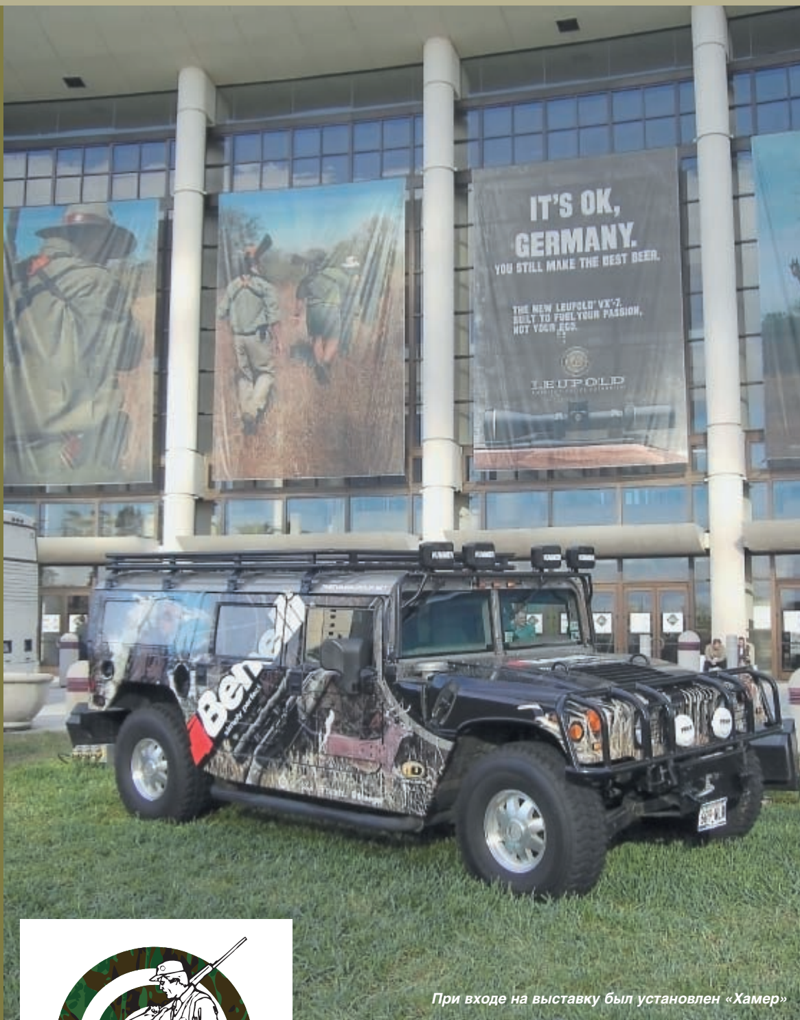
При входе на выставку был установлен «Хамер»