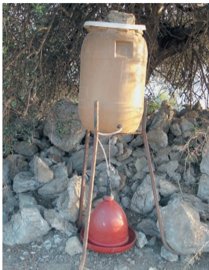
В местах скопления дичи, в тени густых кустарников устанавливаются искусственные поилки

укладывая на землю высохшие посевы и полевые травы, приближается к его середине. Кролики, которыми плотно населены поля, сначала жмутся к центру, а затем, когда полоса растительности остаётся узкой, стремглав бегут наружу, мимо стоящих охотников (больше в такой обстановке похожих на «стрелков») и попадают под выстрел. По сути, это способ охоты замкнутым кругом или так называемым «котлом», где стрельба ведётся только в угон, пропуская зверьков за линию круга. Безусловно, такая охота мало этична и в условиях небольшой численности дичи не должна применяться. К тому же, в наших Правилах охоты имеется статья, запрещающая «применение автотранспортных средств для преследования и добычи любых видов животных». В смысле проявления гуманности на охоте прямое использование транспортных средств в ней также щемит душу настоящего охотника. Но в гостях местные традиции и обычаи не обсуждаются, и мы все, кто с большим, кто с меньшим азартом, провели эту утреннюю охоту на дикого кролика.