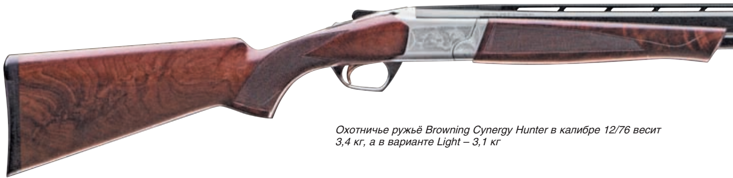
Охотничье ружьё Browning Synergy Hunter в калибре 12/76 весит 3,4 кг, а в варианте Light – 3,1 кг