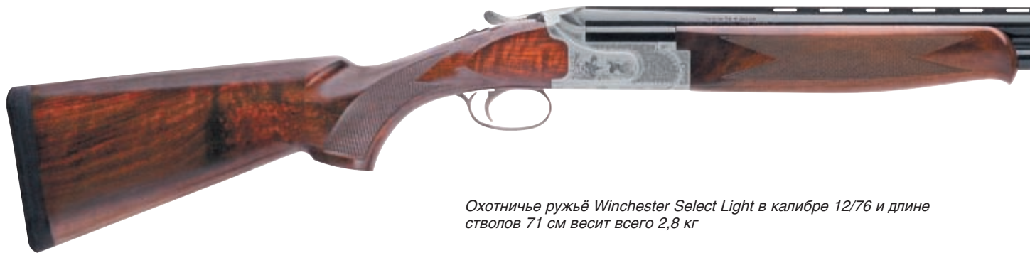
Охотничье ружьё Winchester Select Light в калибре 12/76 и длине стволов 71 см весит всего 2,8 кг

собак. Из Испании ведут своё происхождение и группа пород спаниелей, не имеющих себе равных по стилю и динамичности работы, аллюру, азарту и физической выносливости. Их потомков в XI-XII вв. вывозили в другие европейские страны и называли испанками: во Франции – эспаньолами, в Италии – шпаньолами, в России – шпанками.