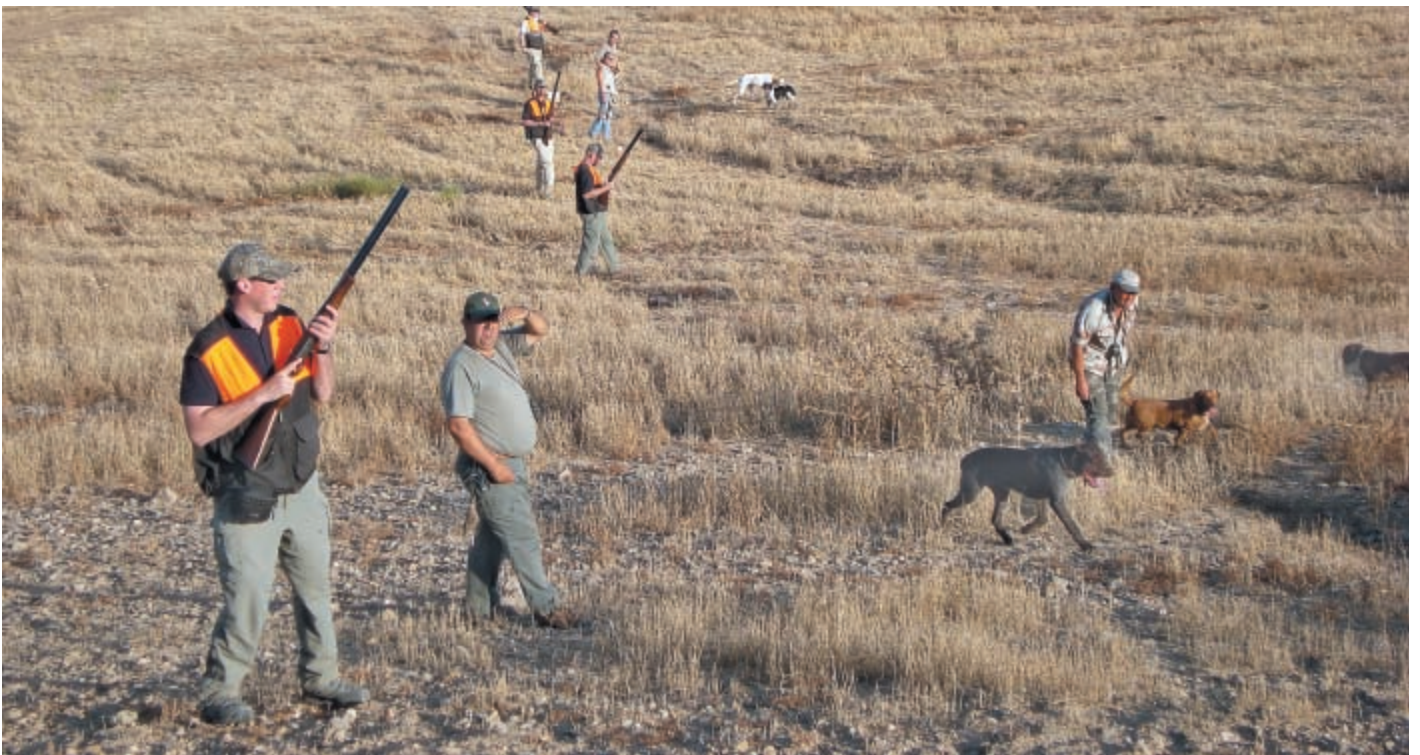
Так, находясь в цепи и стараясь выдержать линию, мы продвигались по угольям, отыскивая дичь и разбирая ситуацию

С другой стороны, перепел оказался очень интересным объектом спортивной охоты, особенно при таком его обилии в угольях и хорошей работе подружейных собак. Стрельба перепела, хотя и быстро срывающегося, но