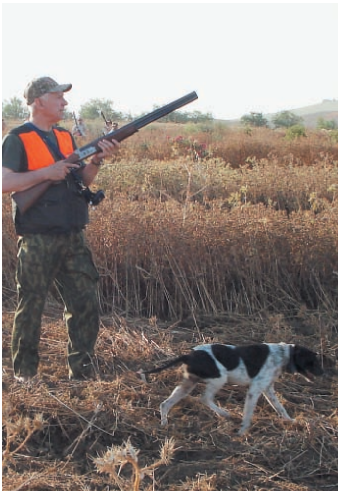
Непростая это работа – в Андалусии на охоте добывать... перепела и дикого кролика

Не меньший интерес представлял на охоте и процесс управления собаками. Более послушные и опытные легко управлялись жестами и командами своих хозяев,