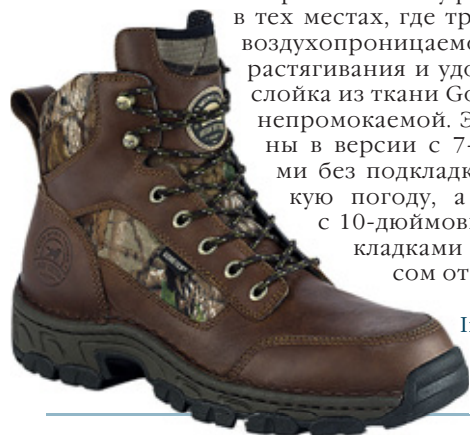
Irish Setter Boots, 888/738-8370 irishsetterboots.com

Новые охотничьи ботинки Navoc от фирмы Irish Setter – это лёгкая, хорошо амортизирующая и прекрасно поддерживающая стопы и лодыжки обувь. Технология FlexLock обеспечивает максимальную гибкость ступни, предотвращая в то же время её «болтание» в ботинке. Подошва UltraFlex Big Game обеспечивает надёжную опору, и она стабильно удерживала меня даже на скользком и крутом каменистом склоне, где я испытывал эту обувь. Верх сделан из кожи высшего качества со вставками из прочного камуфляжного материала в тех местах, где требуется обеспечить воздухопроницаемость, возможность растягивания и удобство, причём прослойка из ткани Gore-Tex делает обувь непромокаемой. Эти ботинки доступны в версии с 7-дюймовыми берцами без подкладки для охоты в жаркую погоду, а также в варианте с 10-дюймовыми берцами с подкладками Thinsulate Ultra весом от 400 до 800 г.