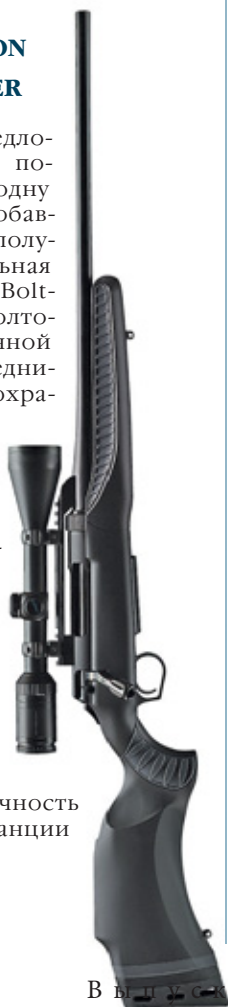
Thompson/Center Arms, 866/730-1614 TCArms.com или dimensionrifle.com

Это новое инновационное предложение компании Thompson/Center позволит вам выбрать сначала только одну винтовку, а потом постепенно добавлять к ней новые стволы и детали, получая другие калибры. Эта вариабельная винтовка начинается с Dimension Bolt-Action Platform – универсальной «болтовой» ствольной коробки, разработанной для использования с короткими, средними и длинными патронами при сохранении необходимого хода затвора для каждой такой группы. Смена калибра производится путём замены четырёх деталей – ствола, затвора, магазина и приёмника магазина. Полномерная ложа с высокой щекой создана для удобной изготовления и имеет крупную рельефную насечку на цевье, способствующую надёжному хвату даже в дождливую погоду. Две съёмных прокладки толщиной в полдюйма позволяют отрегулировать длину приклада для стрелка любой комплекции. Ствол свободно вывешен по всей длине, и для данной модели производитель гарантирует кучность в одну угловую минуту на дистанции 100 ярдов.