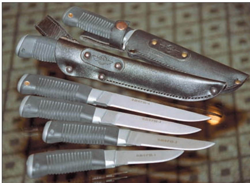
Сверху-вниз: «Смерш-5» и «Смерш-4» в ножнах, «Смерш-4», «Смерш-3», «Смерш-2», «Смерш-1»

чески не претерпел никаких изменений, разве что теперь он снабжается штатным темляком.