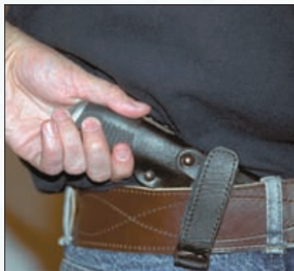
Благодаря особой конструкции подвесной системы, ножи «Смершей» (кроме «пятьёрки») можно закрепить на поясном ремне не расстёгивая его. Дополнительная петля на ножнах обеспечивает возможность ношения ножа горизонтально за поясом