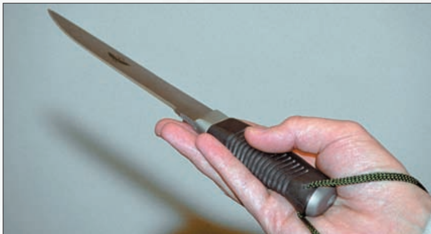
Форма рукоятки «Смерша» позволяет с одинаковым удобством использовать любой привычный для владельца и удобный в конкретной ситуации хват. В рукоятке предусмотрено отверстие для крепления страховочного шнура

На базе боевой модели был разработан вариант хозяйственно-бытового назначения с толщиной клинка 2,4 мм. На первых образцах в передней части клинка сохранялся шоковый зуб, но впоследствии стали выполнять более удобную обычную заточку. Появился интересный