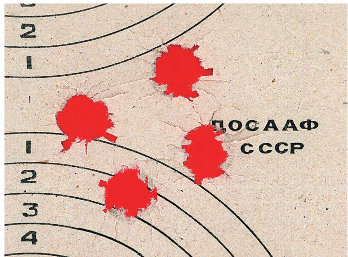
Результаты стрельбы из ружья Karatay TK-355 пулей «Полева-3». На дистанции 25 метров поперечник по центрам пробоин 5 см