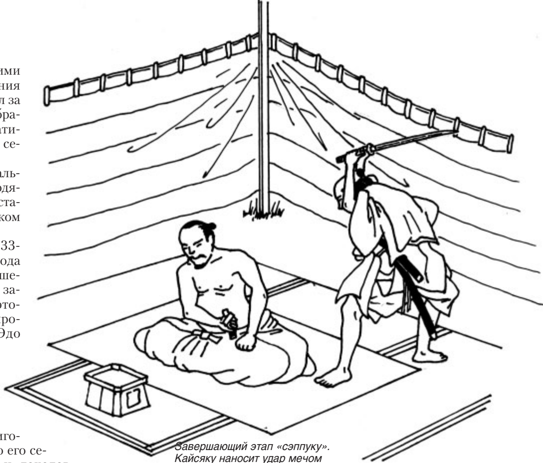
Завершающий этап «сэппуку». Кайсяку наносит удар мечом

Осуждённому предоставлялось право самому выбрать из числа своих друзей секунданта («кайсяку») и двух его помощников. Секундант благодарил за оказанную ему