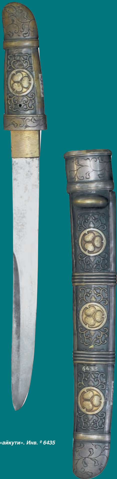
Нож «айкути». Инв. № 6435

стала управлять страной. Прекрасная наездница и отважная женщина, обладала большой физической силой и мастерски владела оружием. На поле боя она обычно была рядом с мужем Ёсинака (племянником императора Миnamото Ёситомо). Её участие в битве и личное мужество воодушевляло воинов на боевые подвиги. В сражении при Авадзу-но-Хара она поразила нескольких вражеских воинов, в том числе и их предводителя, отсечённую голову которого она торжественно преподнесла своему мужу.