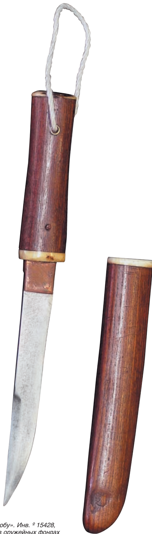
Нож «кусун-гобу». Инв. № 15428, хранящийся в оружейных фондах Центрального военно-морского музея в Санкт-Петербурге

Причин для совершения «харакири» было несколько. Для каждого вида самоубийства в японском языке имеется собственный термин. Так, например, самурай лишил себя жизни вслед за произошедшей смертью своего господина. Месть обидчику за смерть (оскорбление) своего господина считалась у самураев делом чести.