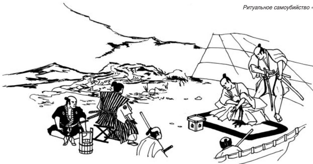
Ритуальное самоубийство «сэппуку»