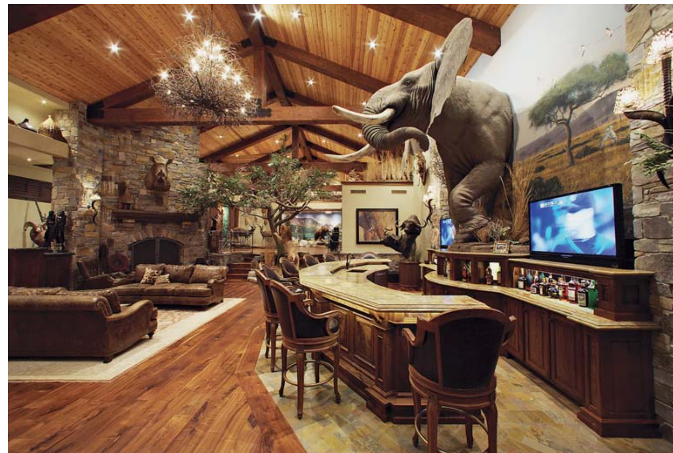
В этом зале весьма выгодно смотрятся африканские трофеи, но здесь ещё и подходящий интерьер для развлечения гостей, привлекательный и уютный, как для охотников, так и тех, кто к ним не относится

«Это должно быть частью структурной конструкции при строительстве трофейного кабинета, – поясняет Джулиан. – Вы же не хотите, чтобы вам просто повсюду вколотили гвозди? Поэтому и нужно иметь план».