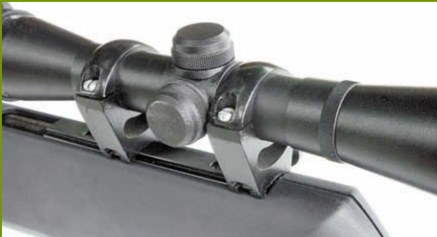
Из-за смещения «ластохвоста» вперёд коробка ввода поправок прицела «Пилад» 4х32 сдвигается к заднему кольцу, а само кольцо ставится на импровизированный упор, образуемый половинками ложи

Существенное изменение претерпела муфта ствола. Если в версии