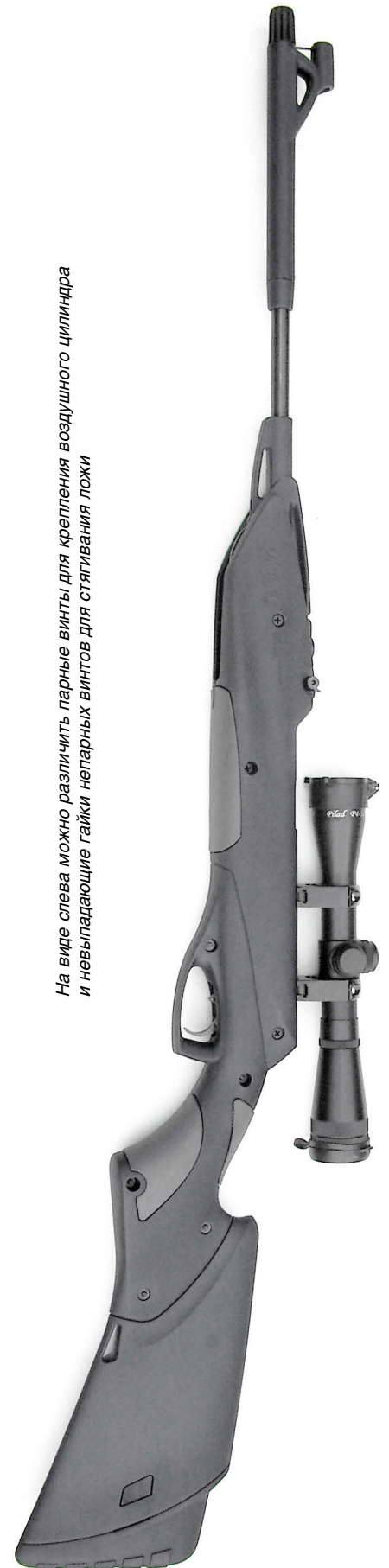
На виде слева можно различить парные винты для крепления воздушного цилиндра и невыпадающие гайки непарных винтов для стягивания ложи