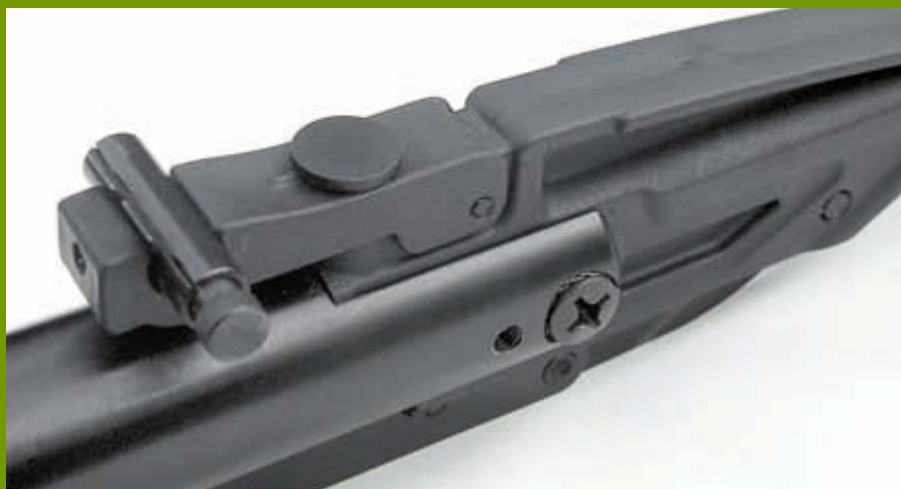
Отделив ложу, можно увидеть, как устанавливается прицельная планка на муфте ствола. Она является как бы продолжением переднего ската прилива муфты. Кстати, вертикальные и горизонтальные поправки снова вводятся рукой

В общем, я, как заинтересованное лицо, уходил с «Оружия и охоты-2004» воодушевлённым и полным надежд на скорое серийное производство обновлённой винтовки, хотя