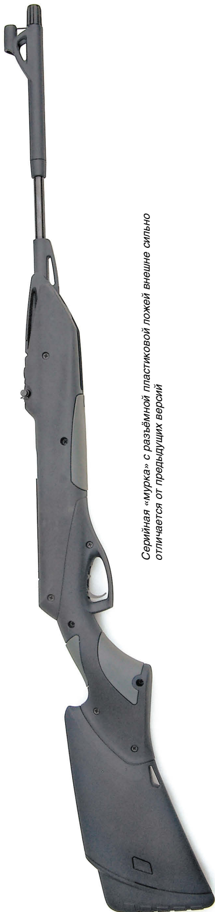
Серийная «мурка» с разъемной пластиковой ложей внешне сильно отличается от предыдущих версий