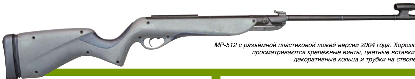
MP-512 с разъемной пластиковой ложей версии 2004 года. Хорошо просматриваются крепёжные винты, цветные вставки, декоративные кольца и трубки на стволе