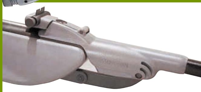
Муфта ствола версии 2005 года сильно изменилась: добавилась передняя втулка, появился прилив для прицела. Обратите внимание, что вернулся привычный барабанчик ввода боковых поправок (хотя вертикальные по-прежнему вводятся с помощью отвёртки)