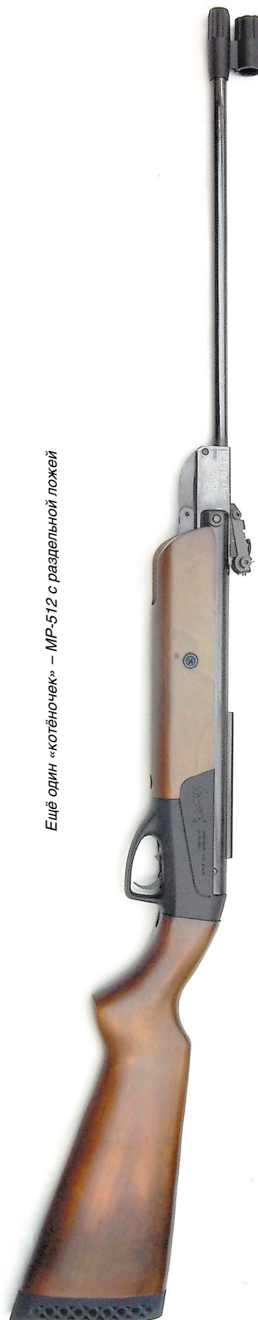
Ещё один «котёночек» – МР-512 с раздельной ложей

Говорят, что у кошки девять жизней. Будем надеяться, что это так, и ижевская «мурка» принесёт ещё много новых «котят» со своими собственными именами.