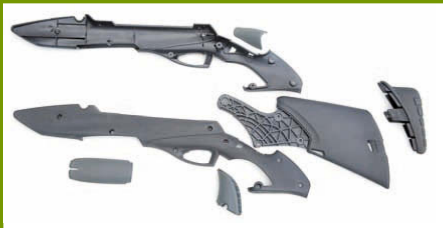
Элементы новой ложи: левая и правая половины, приклад, съёмный затылок приклада, вставки из мягкого пластика

в «П»-образную скобу как раньше, что даже без опробования стрельбой позволяло говорить о более надёжной фиксации и существенном снижении вероятности откручивания винтов (кто с этим сталкивался – тот меня поймёт).