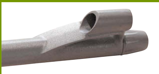
Совершенно новый дизайн узла мушки (2005 год)