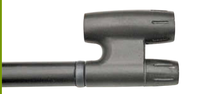
Узел мушки версии 2004 года. Похож на базовый вариант, но уже есть внешние отличия

К стати, по поводу «мурки»... Сначала это название мне это не совсем понравилось, точнее не понравилось совсем. Как-то несерьёзно и не-solidно. Потом, вспомнив про своё 15-летнее совместное существование в одном доме с представителями семейства кошачьих, я мнение изменил. Ведь будучи «дворянкой», к примеру в седьмом поколении, и пройдя суровую школу выживания на улице, Мурка способна на гораздо более искреннюю привязанность и любовь к приютившему её человеку, чем самоходное украшение дивана по имени Герцог ...ский ...надцатый, считающее себя центром мироздания и ведущее соответствующий образ жизни. Так и с винтовкой. Моя первая «пятьсот двенадцатая» 1998 года выпуска с качественно изготовленным стволом долго служила верой и правдой