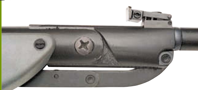
Муфта ствола версии 2004 года. Видно, что прицел стал более компактным, и что для ввода боковых поправок нужен инструмент