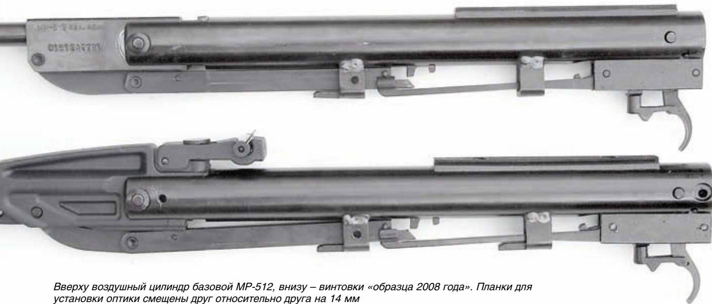
Вверху воздушный цилиндр базовой MP-512, внизу – винтовки «образца 2008 года». Планки для установки оптики смещены друг относительно друга на 14 мм

2004 года она отличалась от базовой только двумя цилиндрическими наплывами, которые как бы являлись продолжением вилки воздушного цилиндра, то теперь это была деталь сложной формы с дополнительной втулкой для ствола спереди и приливом сверху для установки прицела, который перестал быть легкосъёмным. В общем, его можно было бы назвать несъёмным, но вы же помните, что «...ежели один человек построил, другой всегда разобрать может». Под форму прилива изменилась и прицельная планка, на которую, в отличие от предыдущей версии, установили привычный барабанчик ввода горизонтальных поправок.