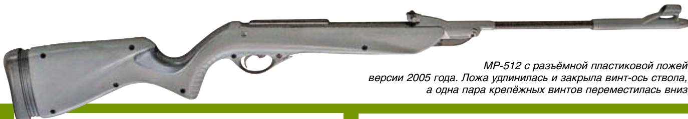
MP-512 с разъемной пластиковой ложей версии 2005 года. Ложа удлинилась и закрыла винт-ось ствола, а одна пара крепёжных винтов переместилась вниз

Пластиковая ложа этой «переломки» оказалась разъемной, стягиваемой семью непарными винтами в прикладе, шейке и у предохранительной скобы. Воздушный цилиндр крепился в ней двумя парами винтов, вворачиваемых непосредственно в его заднюю часть и вилку, а не