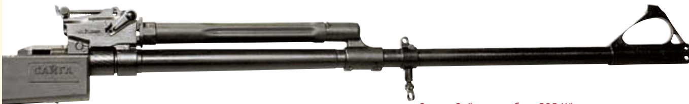
Ствол «Сайги» калибра .308 Win. довольно массивен и в результате передняя часть карабина кажется несколько перетяжелённой