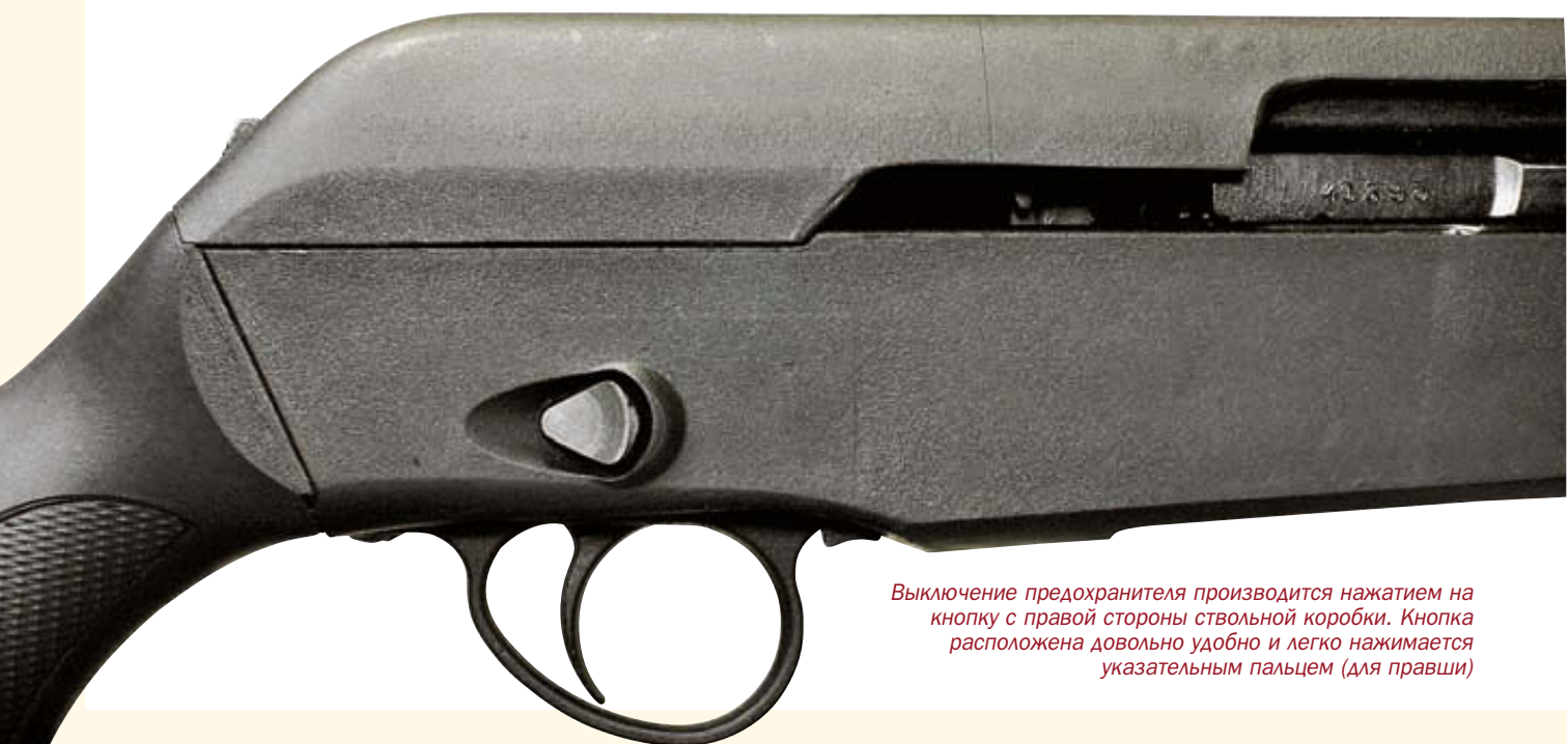
Выключение предохранителя производится нажатием на кнопку с правой стороны ствольной коробки. Кнопка расположена довольно удобно и легко нажимается указательным пальцем (для правши)