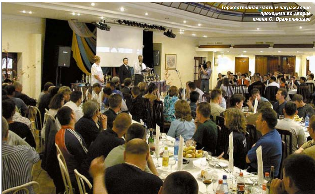
Торжественная часть и награждение проходили во дворце имени С. Орджоникидзе