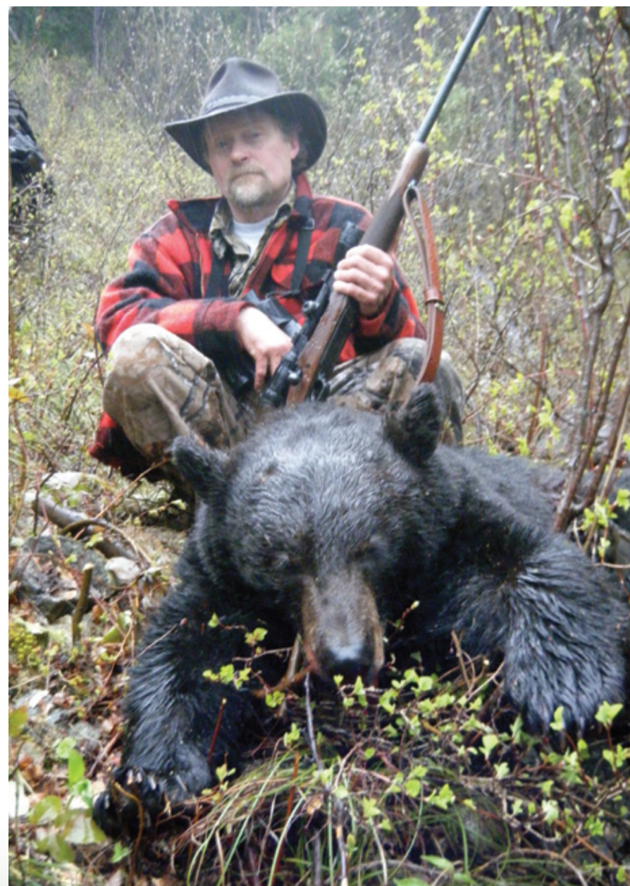
Автор со своим, тяжело добытым скрадом, чёрным медведем на дождливой вершине горы.

Организатором моей охоты была компания Horse Creek Outfitters из города Challis, штат Айдахо. Её лагерь располагался в восьми милях от перевалочного пункта и состоял из двух палаток, одна для охотников, а вторая, побольше, использовалась как кухня-столовая и место расквартирования двух проводников и повара. В каждой палатке были дровяные печки для обогрева, а печь в большой палатке ещё использовалась и для готовки.