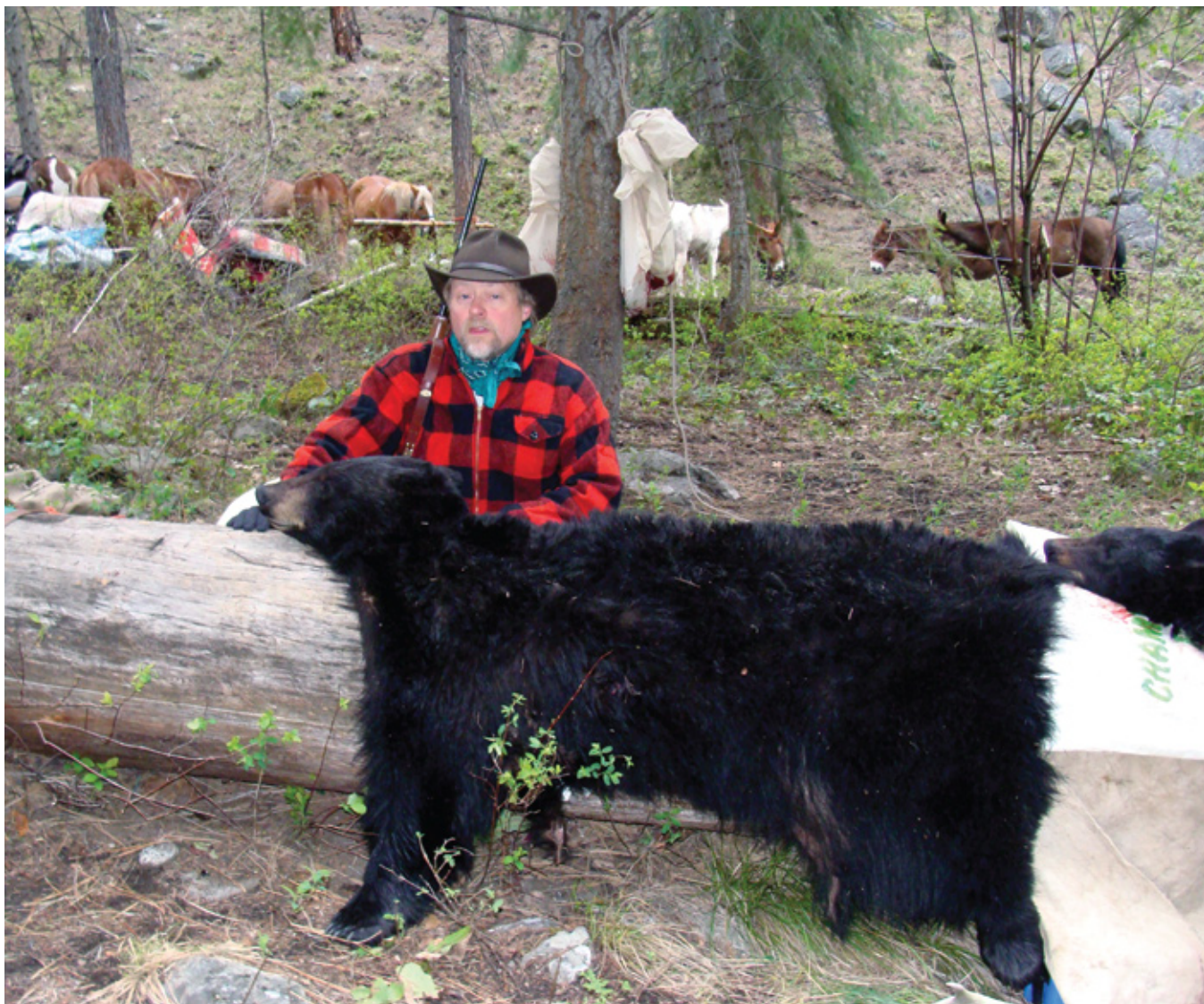
По возвращении в лагерь с медведем.