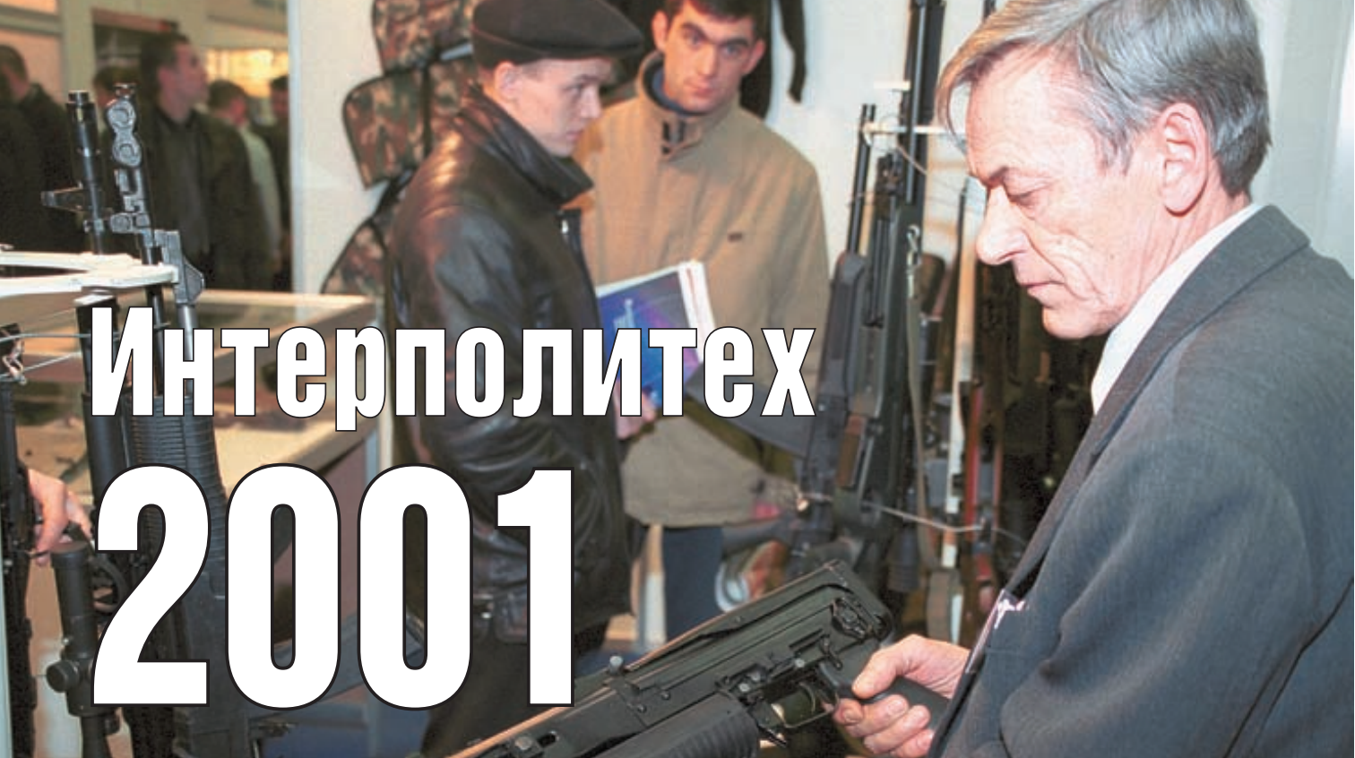
Стенд «Ижмаша». Справа Виктор Михайлович Калашников