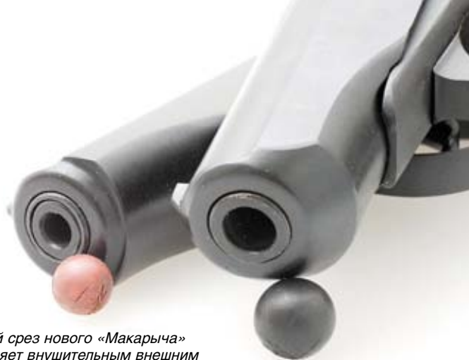
Дульный срез нового «Макарыча» впечатляет внушительным внешним видом. Затвор пистолета .45-го калибра имеет оригинальную узнаваемую «макаровскую» форму