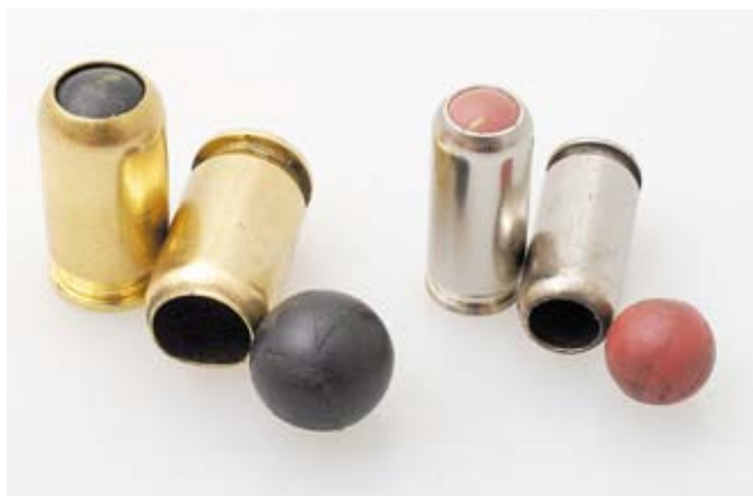
Патроны пули и гильзы для «Макарычей»