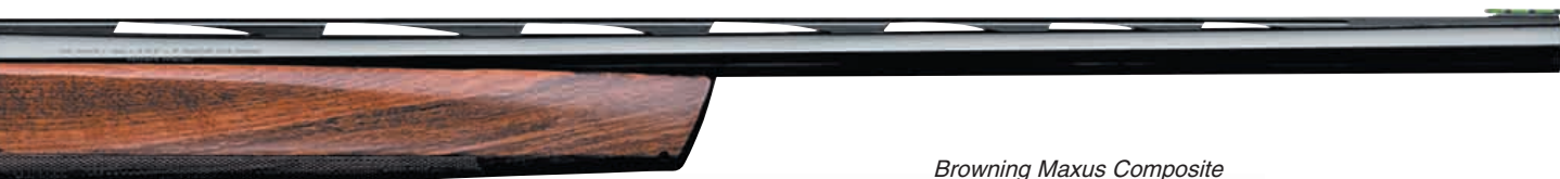
Browning Maxus Composite