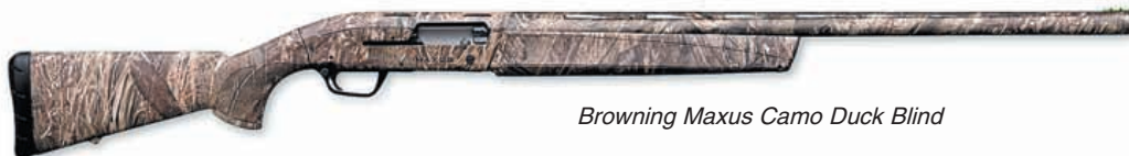
Browning Maxus Camo Duck Blind

получили высокую оценку стрелков и охотников, а Maxus – путёвку в жизнь.