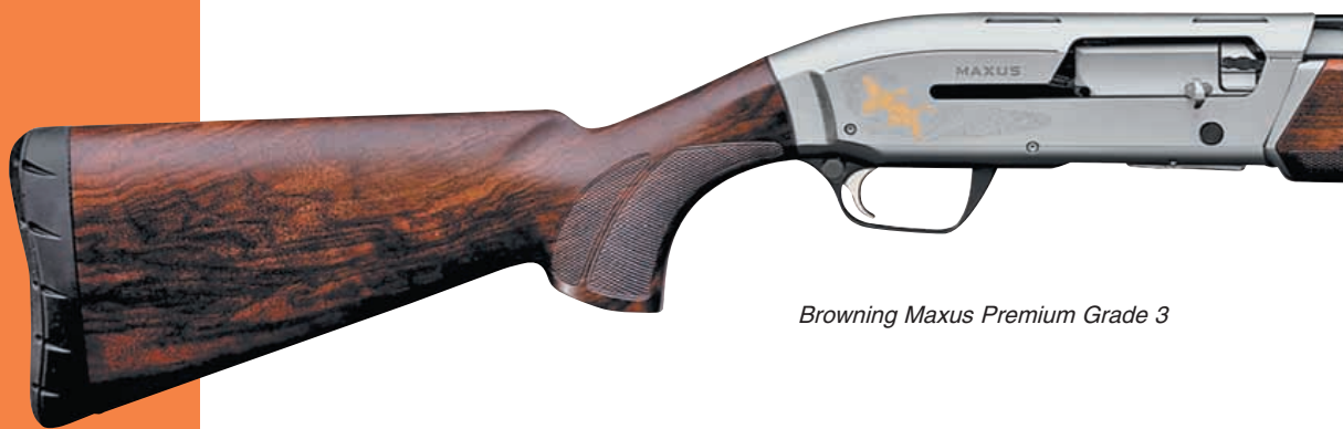
Browning Maxus Premium Grade 3

Прошёл почти год, как в рамках программы полевого тестирования нового самозарядного ружья Browning Maxus я провёл с ним пять превосходных охот на пернатых в саванне западной субэкваториальной Африки, на самом юге Буркина Фасо. Это были нелёгкие в физическом плане охоты на горлиц, диких голубей, африканских куропаток, франколинов-турачей, а также гвинейскую курицу, оказавшиеся в высшей степени эмоциональными и впечатляющими... (см. «КАЛАШНИКОВ», №2/2010 г., «Возвращение в Африку»).