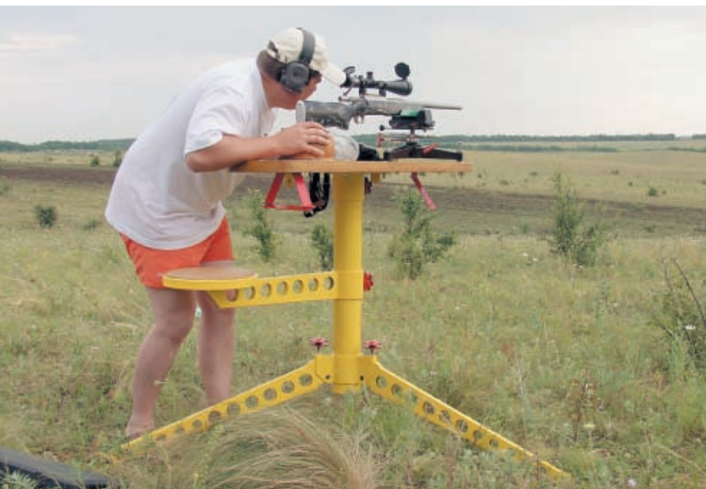
Настройка упоров стрелкового стола

Итак, у меня 2 добытых сурка и один подранок. Из-за подранка чувствую досаду, но что же, это охота всякое случается.