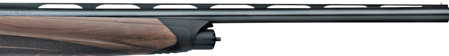
Облегчённое и значительно усовершенствованное ружьё Beretta A 400 Xplor Light в калибре 12/76 со стволом 760 мм

вскидке и поводке. Хотя, как известно, ружьё 20-го калибра в силу параметров своей дробовой осыпи требует более строгой стрельбы, нежели 12-го. Но иногда другие его свойства – высокая посадистость, хорошая прикладистость и великолепный бой стволов творят чудеса как на охоте, так и на стенде. В моём случае, по-видимому, всё так и «срослось».