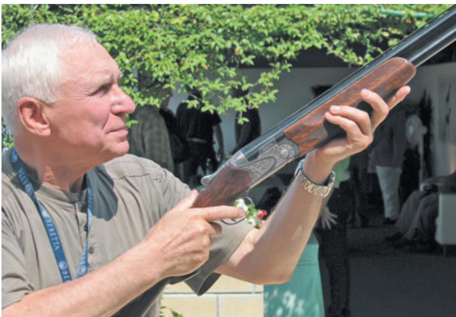
Beretta SV10 Perennia I достойно быть как первым, так и «последним» ружьём в руках охотника

стрельбы использовались спортивные и охотничьи патроны различных марок со снарядами дроби № 7 массой 24, 28, 32, 36, 42, 50 и 56 г.