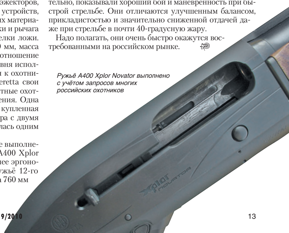
Ружьё A400 Xplor Novator выполнено с учётом запросов многих российских охотников

Надо полагать, они очень быстро окажутся востребованными на российском рынке. ☺