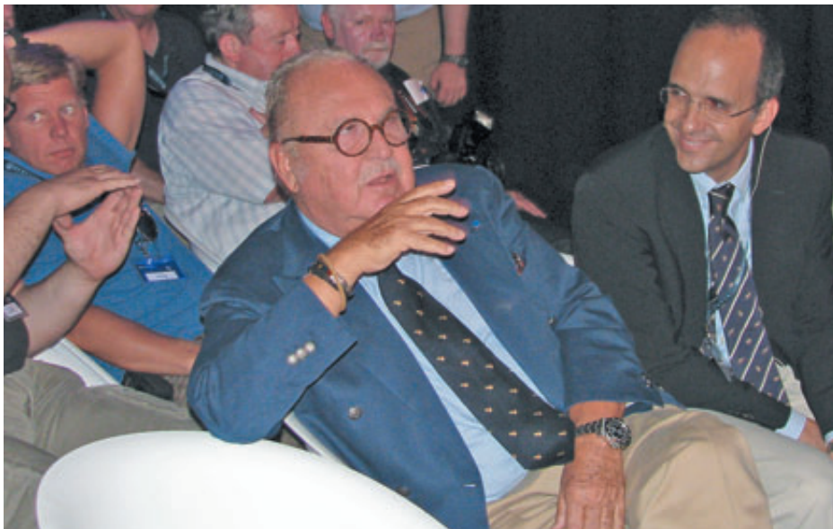
Международный день прессы проходил под руководством и при непосредственном участии президента холдинга Beretta легендарного Уго Гуссалли Беретта

Вся вторая половина дня отводилась стендовой стрельбе из ружей Beretta на двух специально подготовленных для их тестирования площадках компакт-спортинга. Для