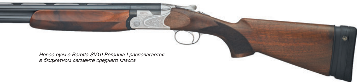
Новое ружьё Beretta SV10 Perennia I располагается в бюджетном сегменте среднего класса