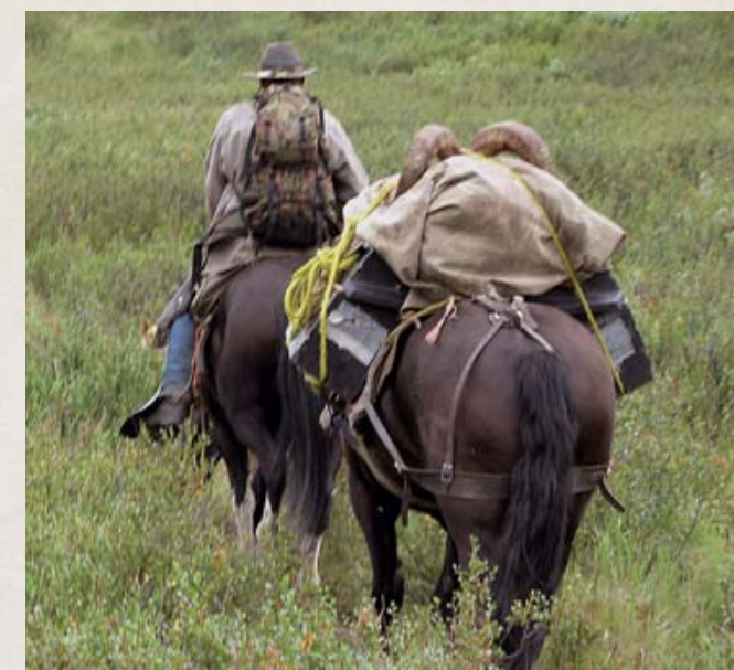
Вам нравится охотиться на диких баранов? Здесь у вас есть шанс дать и кое-что взамен

Для поддержки усилий «Общества Марко Поло» и распространения такого подхода к благотворительности среди всех участников Фонда для диких баранов и сторонников сохранения этих животных Фонд создал новое благотворительное содружество – «Общество содействия баранам Чедвика». В нём существует пять уровней деятельности дарителя, подразумевающих предоставление целевых и безналоговых донорских взносов от 250 до 5000 долларов ежегодно. И они могут быть направлены на определённые оперативные программы по желанию дарителя. Взносы могут быть также сделаны в специализированные фонды WFSF: Дарственный фонд, Природоохранный фонд и/или Оперативный фонд для финансирования специализированных программ и инициатив. Заслуги членов «Общества содействия баранам Чедвика» будут отмечены красиво вышитым знаком, свидетельствующим о «Медном,