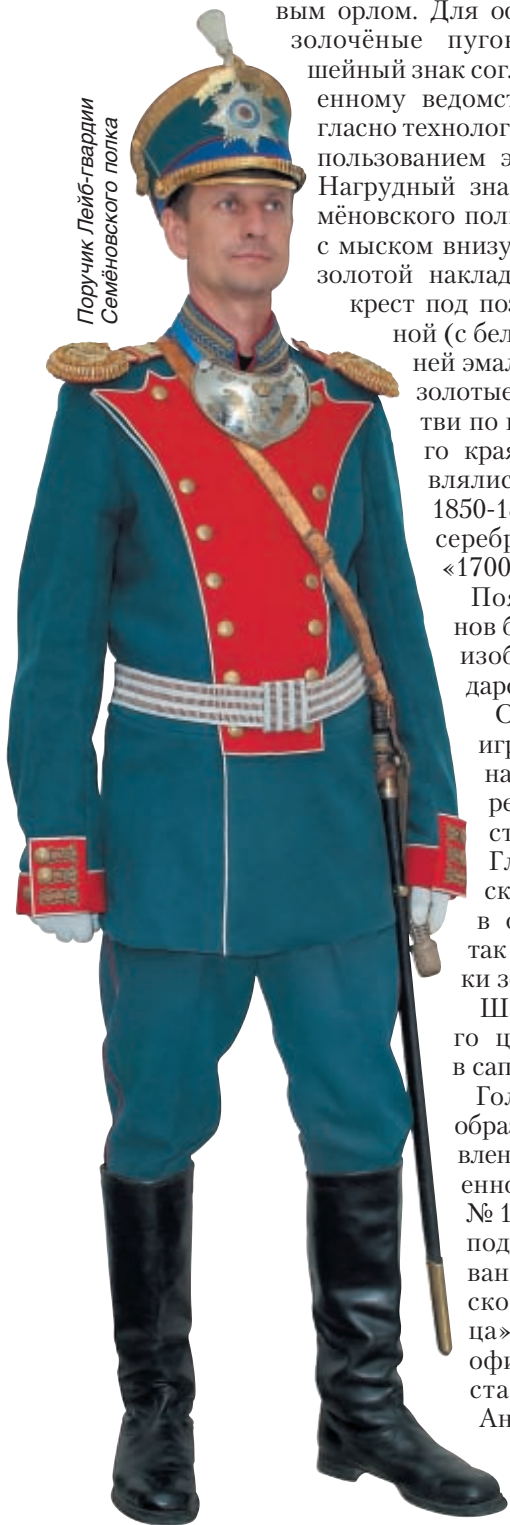
Поручик Лейб-гвардии Семеновского полка