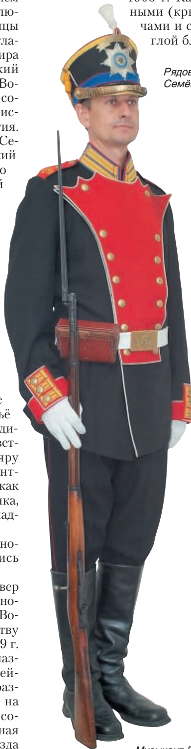
Музыкант Лейб-гвардии Семеновского полка