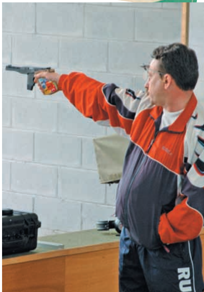
Сергей Алифиренко – наш второй олимпийский чемпион в скоростной стрельбе из пистолета (Сидней, 2000 г.), после А. Кузьмина (1988 г.)