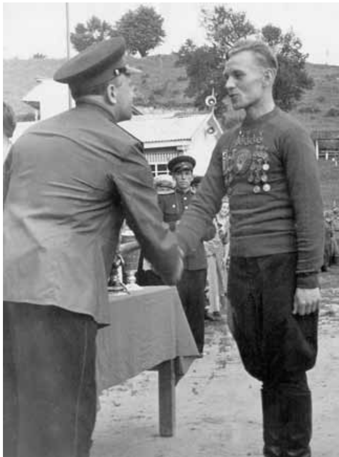
Особую гордость и славу советского и российского стрелкового спорта олицетворяет выдающийся стрелок, наш первый двукратный олимпийский чемпион (1952 и 1956 г.г.) в стрельбе из винтовки Анатолий Богданов

Такая система в национальной школе стрельбы выстраивается десятилетиями. Она должна всегда оставаться эффективной и успевать соответствовать меняющимся технологиям подготовки стрелков высшей квалификации, прикладным научным разработкам и изобретениям,