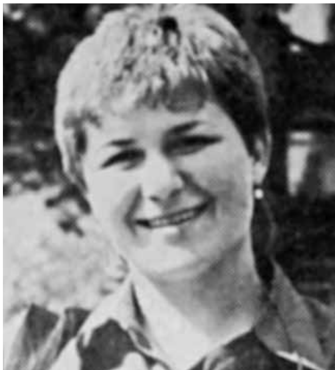
Выдающаяся советская и российская спортсменка, двукратная олимпийская чемпионка (1992 г.) в стрельбе из пистолета, заслуженный мастер спорта Марина Логвиненко (Добранчева)