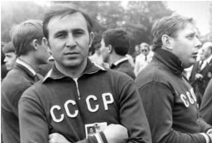
Два великих стрелка СССР и России, многократные рекордсмены и чемпионы Европы и мира в стрельбе из пистолета, заслуженные мастера спорта, ленинградцы Анатолий Егрицин (слева) и Владимир Столыпин