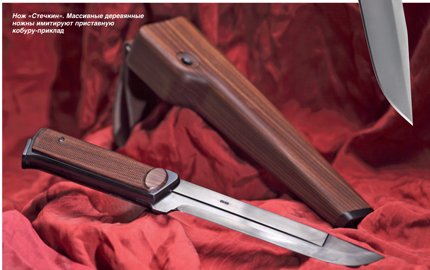
Нож «Стечкин». Массивные деревянные ножны имитируют приставную кобуру-приклад