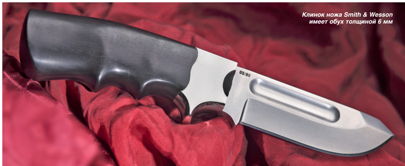
Клинок ножа Smith & Wesson имеет обух толщиной 6 мм

близкий по составу к 440С), формы Spear-point. Подвергать потенциальных владельцев риску обращения и хранения холодного оружия и делать полуторную заточку дизайнеры не стали, зато снабдили нож агрессивными долами. Рукоять ножа из авиационного алюминиевого сплава 2024Т4 с эбеновыми накладками и формой, и текстурой повторяет рукоятку пистолета. Массивный нож с приятным балансом. При рабочем хвате в руке нож ощущается много легче, чем есть на самом деле. Вообще удачный баланс – это отличительная черта всех «глетчеровских» ножей. Винтажные ножны из серебрёной и патинированной латуни с закруглением на конце имеют штыковой подвес из чёрной кожи. Каждый нож (а всего на стенде Sport Manufacturing Group Inc я увидел семь моделей) выпущен ограниченной серией в 98 штук на весь мир. На клинках выдавлен свой уникальный серийный номер.