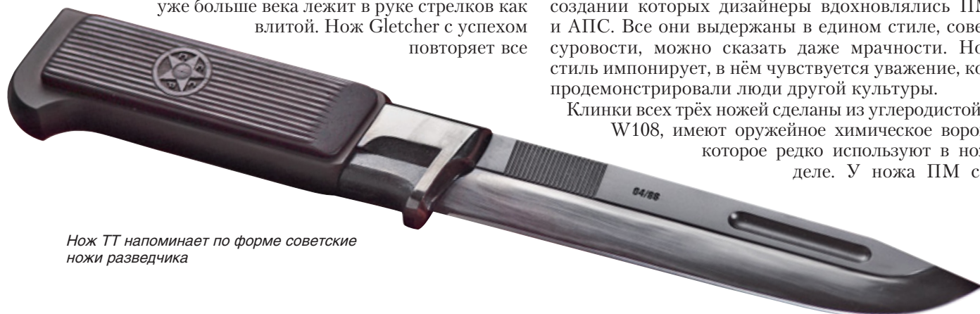
Нож ТТ напоминает по форме советские ножи разведчика

Клинки всех трёх ножей сделаны из углеродистой стали W108, имеют оружейное химическое воронение, которое редко используют в ножевом деле. У ножа ПМ спуски