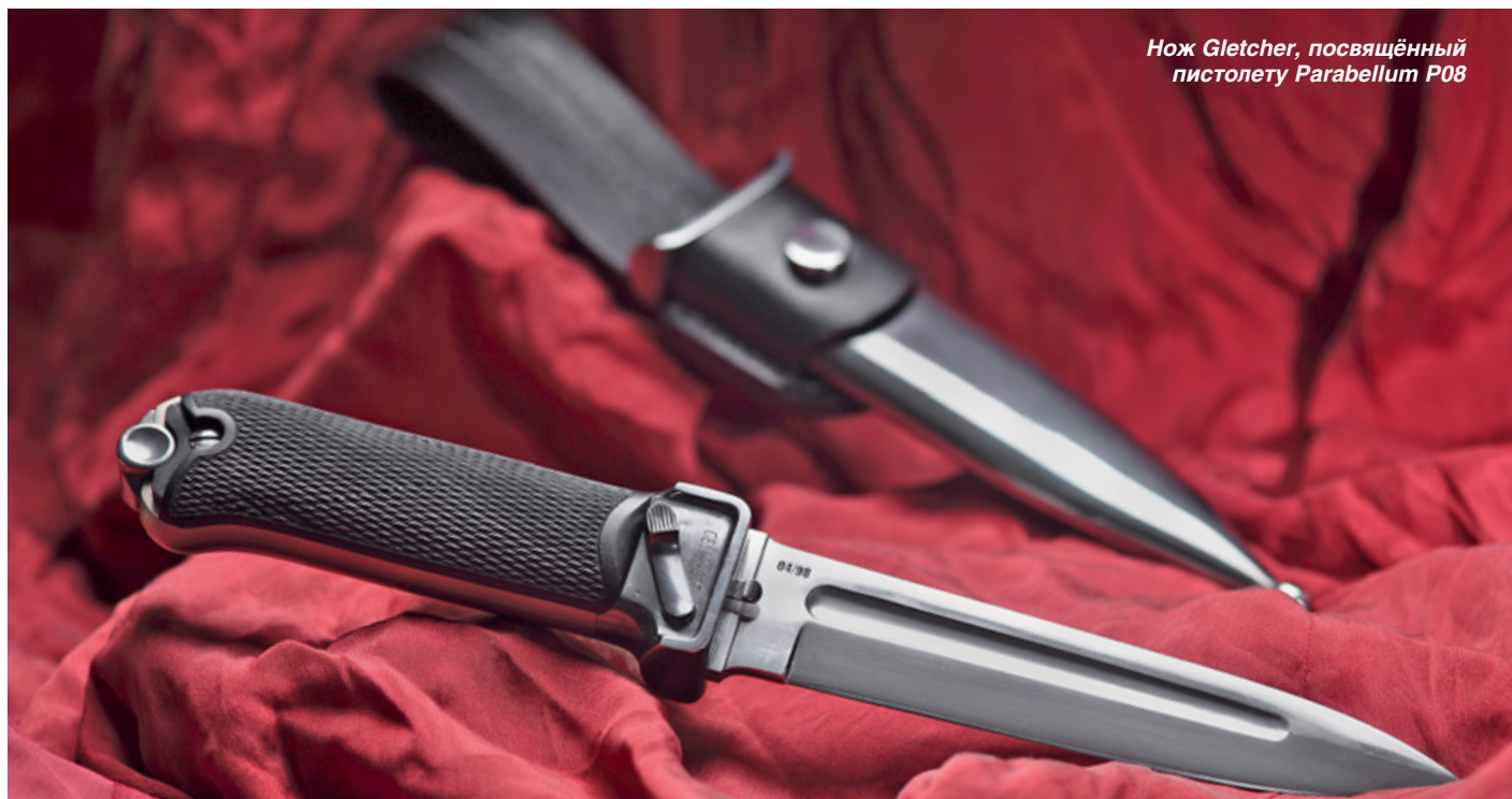
Нож Gletcher, посвящённый пистолету Parabellum P08

Gesichert... В переводе с немецкого «безопасно» написано на ограничителе ножа Gletcher, посвящённого пистолету Parabellum P08. Что безопасного может быть в агрессивном ноже, в котором читается стиль и штыка, и окопного немецкого ножа времён Первой мировой войны? Подержав в руках, выясняется, что это специальный предохранитель, препятствующий случайному извлечению клинка из ножен. Точно такое же слово Gesichert выдавлено сбоку на рамке пистолета Parabellum P08 – чтобы стрелок понимал, есть ли патрон в патроннике. Чтобы извлечь нож Gletcher из ножен, тоже следует нажать на предохранитель и сместить его так, чтобы скрыть безопасную метку Gesichert. Полированный клинок из нержавеющей стали A473 (германский аналог