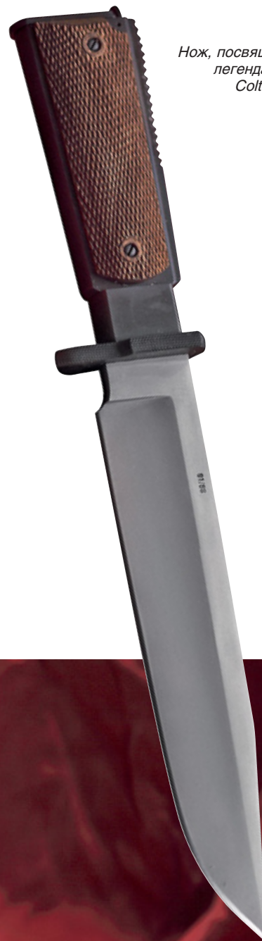
Нож, посвящённый легендарному Colt M1911