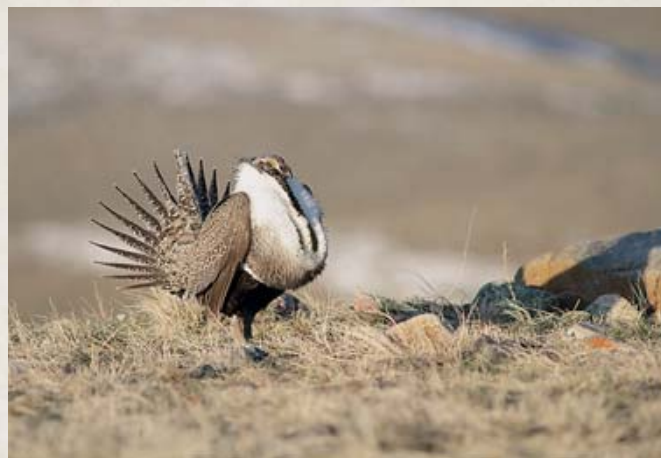
Шалфейный тетерев токует в своём брачном наряде

К сожалению, популяция шалфейных тетеревов резко сокращается, и это – весьма тревожная новость для тех, кому безразличен Запад. Похоже, осталось не более 200 тысяч этих птиц, гнездящихся на земле (по сравнению, вероятно, с 16 миллионами в XIX в.) и подвергшихся тяжким испытаниям в результате бума в развитии нефтегазовой отрасли и превращения их равнин – мест их природного обитания – в торговые центры и возделываемые поля. Сокращение их численности настолько значительно, что Служба охраны рыбы и дичи США предложила внести шалфейного тетерева в категорию «угрожаемого» вида в соответствии с Актом об охране видов, находящихся под угрозой исчезновения (ESA), уже в 2015 г. И такое решение не относится к тому, чего бы желало большинство жителей Запада, поскольку оно наложит ограничения на каждого – от владельцев ранчо до буровиков, так что у всех имеются сомнения,