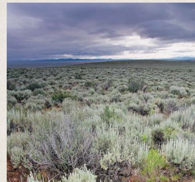
Тетереву, как и вилорогу, и чернохвостому оленю, требуется просторная среда обитания на полынных равнинах