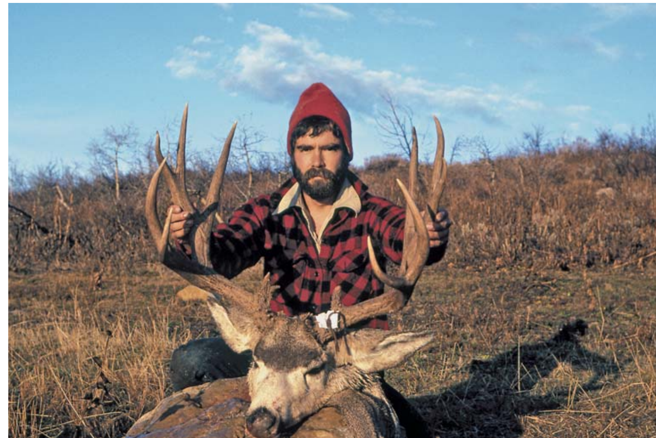
Ещё один отменный чернохвостый олень, взятый на охоте с рюкзаком

с «черёмухой», от которой пере-хватывает дыхание.