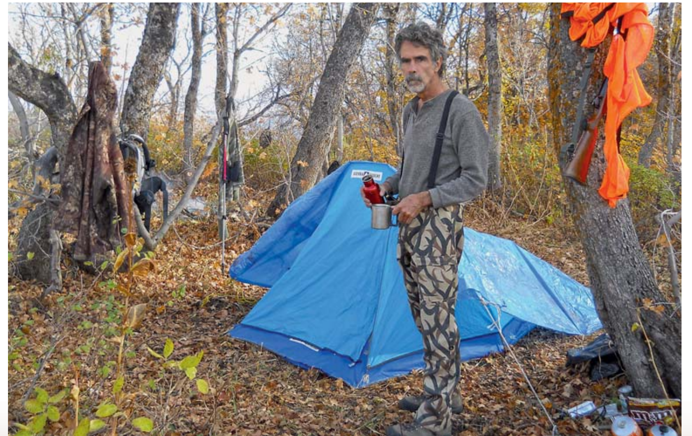
Протеро и его лагерь 2012 г. на чернохвостого оленя на просторах Юты

И я вряд ли отвечу ей прямо: «Да никогда!»